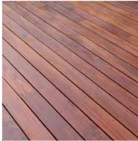
CUMARU: ALBERCA, YOGA