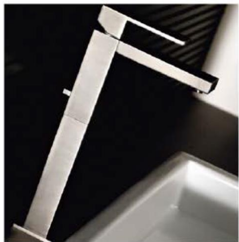
HELVEX: GRIFERIA Y ACCESORIOS DE BAÑO