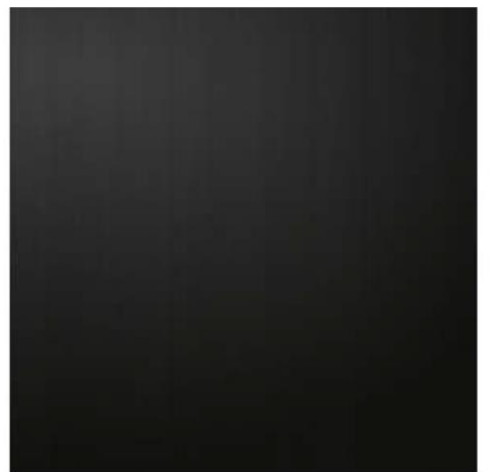
ALUMINIO CUPRUM: VENTANERIA