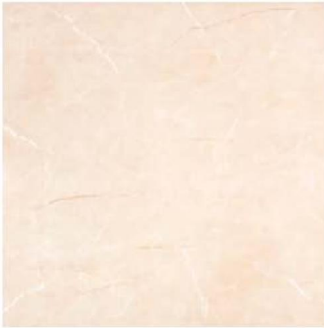
CHUKUM: INTERIORES, EXTERIORES