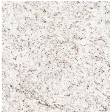
GRANITO: COCINA INTEGRAL