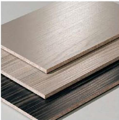
MELAMINA: COCINA INTEGRAL