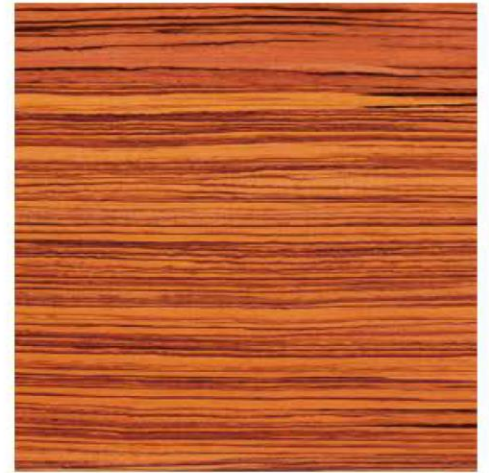
ALUCOBON: FACHADA FRONTAL