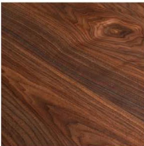
COLOR CHECHEN: PUERTAS Y CLOSETS