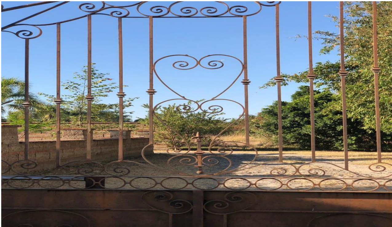
ENTRADA A TERRENO