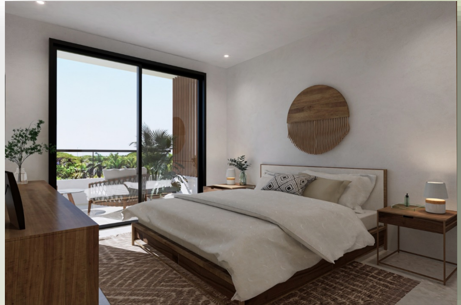
Renders Modelo B