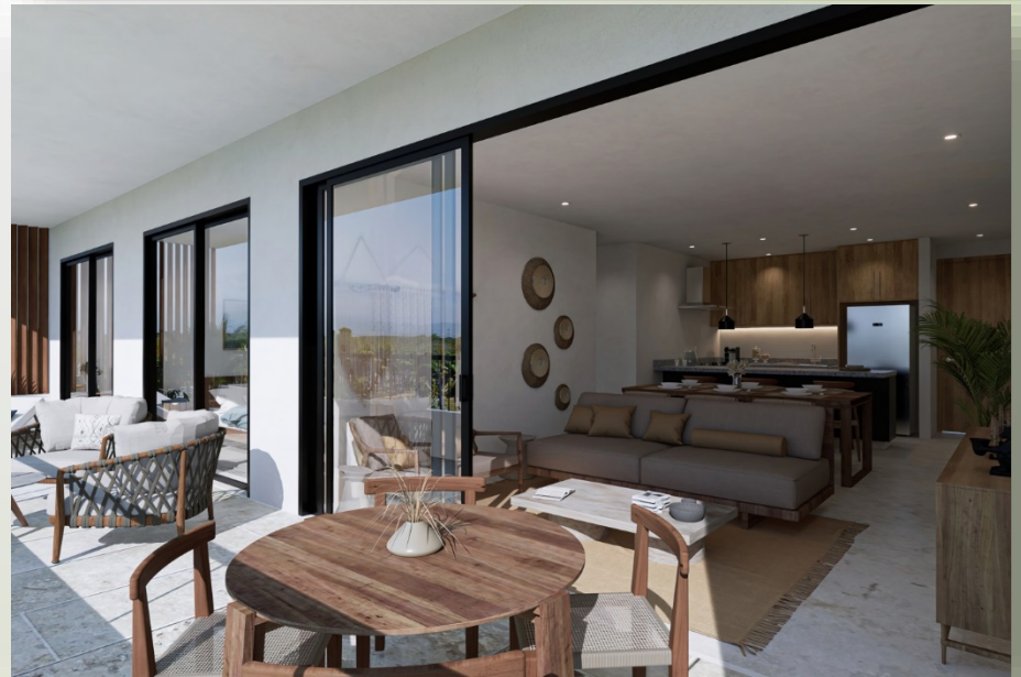
Renders Modelo C