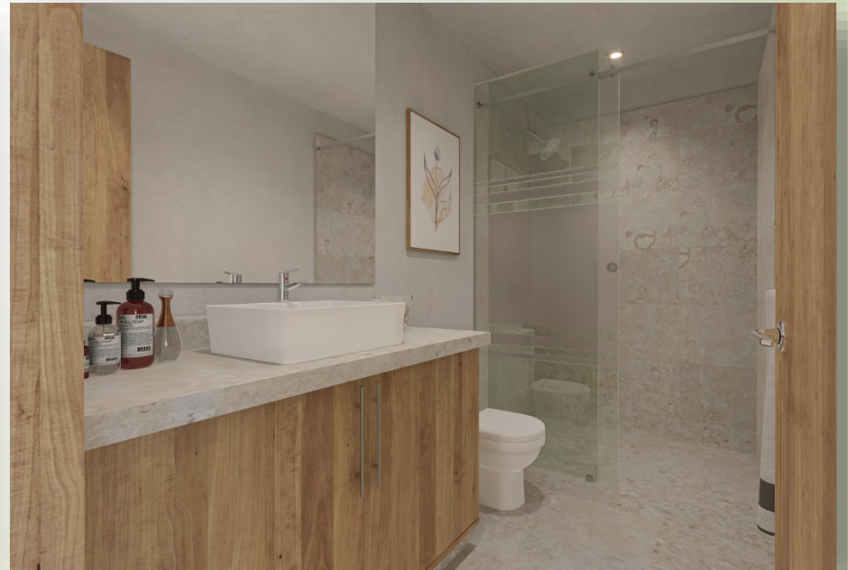
Renders Modelo A