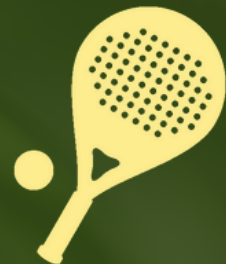
CANCHA DE PADEL