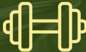
GYM AL AIRE LIBRE