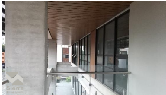
VISTA DE LA TERRAZA