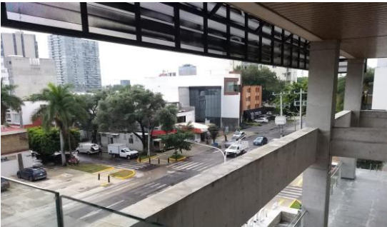
VISTA DE LA TERRAZA