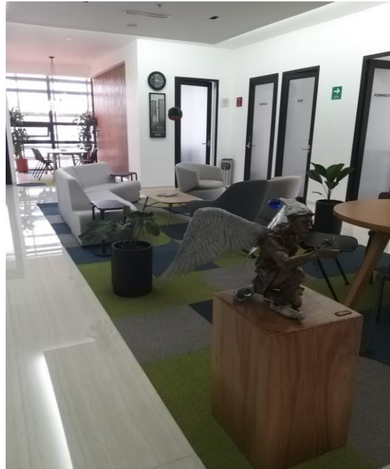
SALAS DE ESPERA