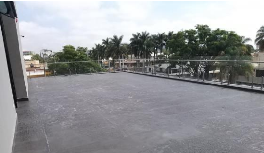
VISTA DE LA TERRAZA