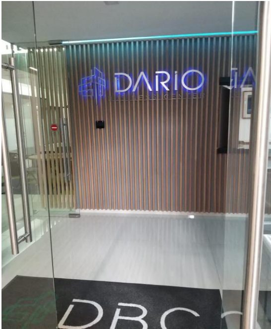
INGRESO A BUSINESS CENTER