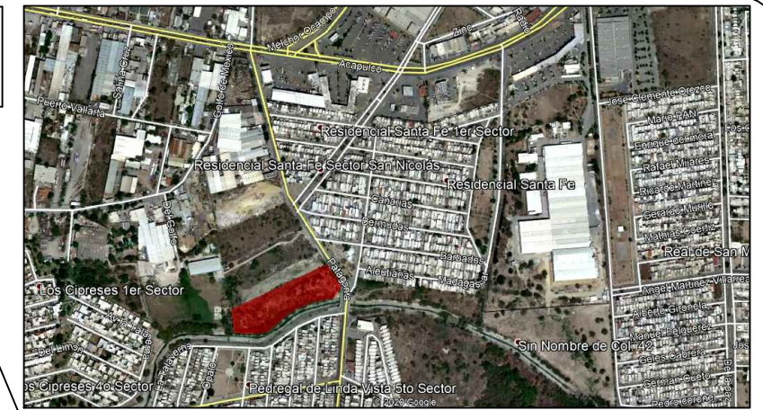
PLANTA DE LOCALIZACION SIN ESCALA