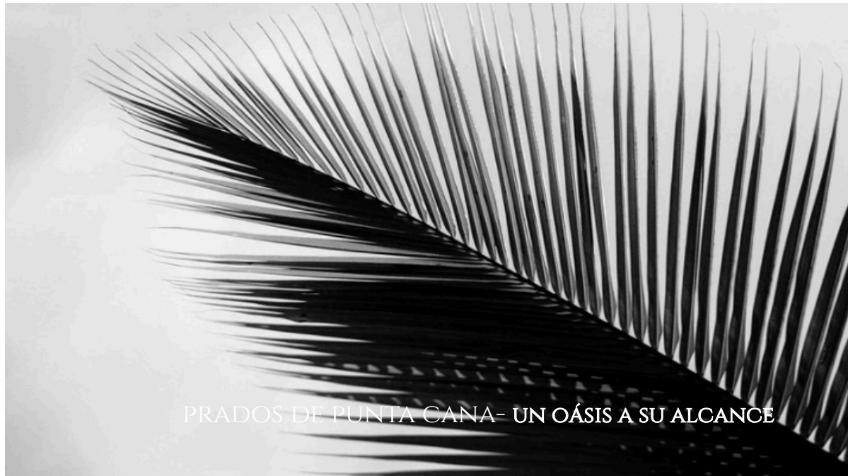
PRADOS DE PUNTA CANA- UN OÁSIS A SU ALCANCE