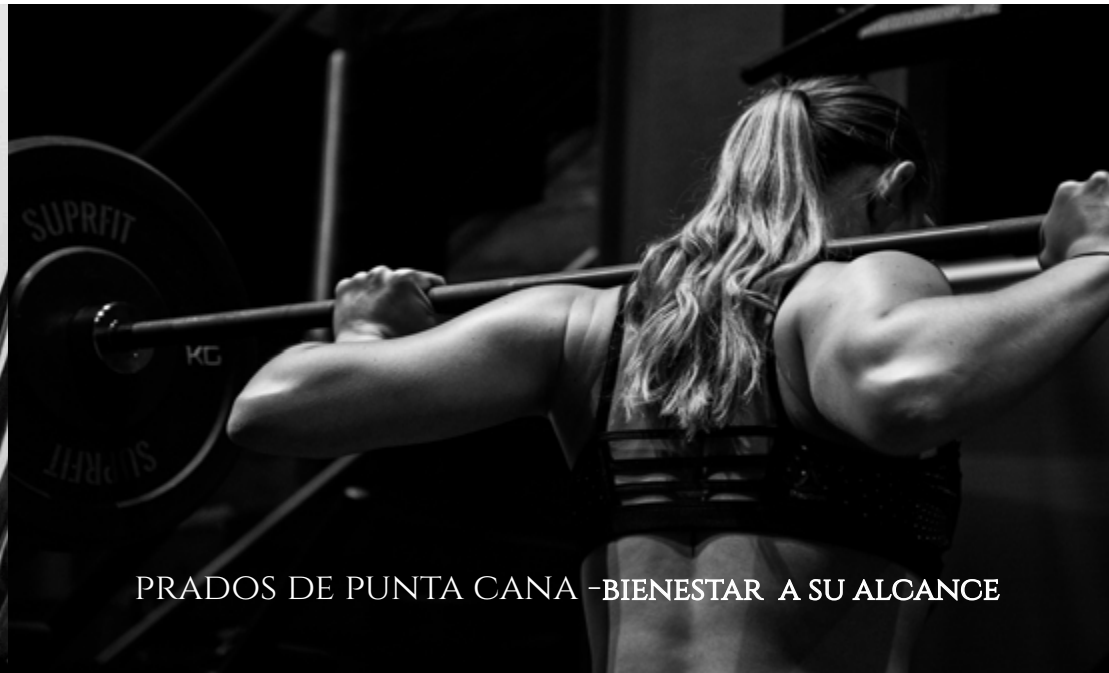
PRADOS DE PUNTA CANA -BIENESTAR A SU ALCANCE