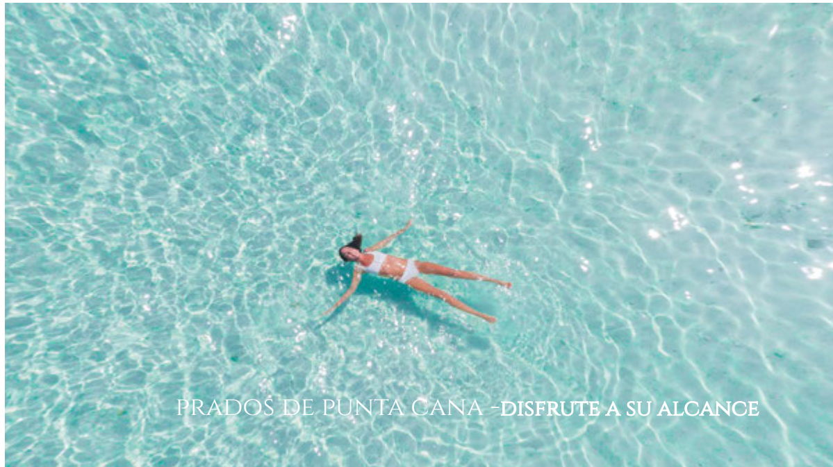
PRADOS DE PUNTA CANA -DISFRUTE A SU ALCANCE