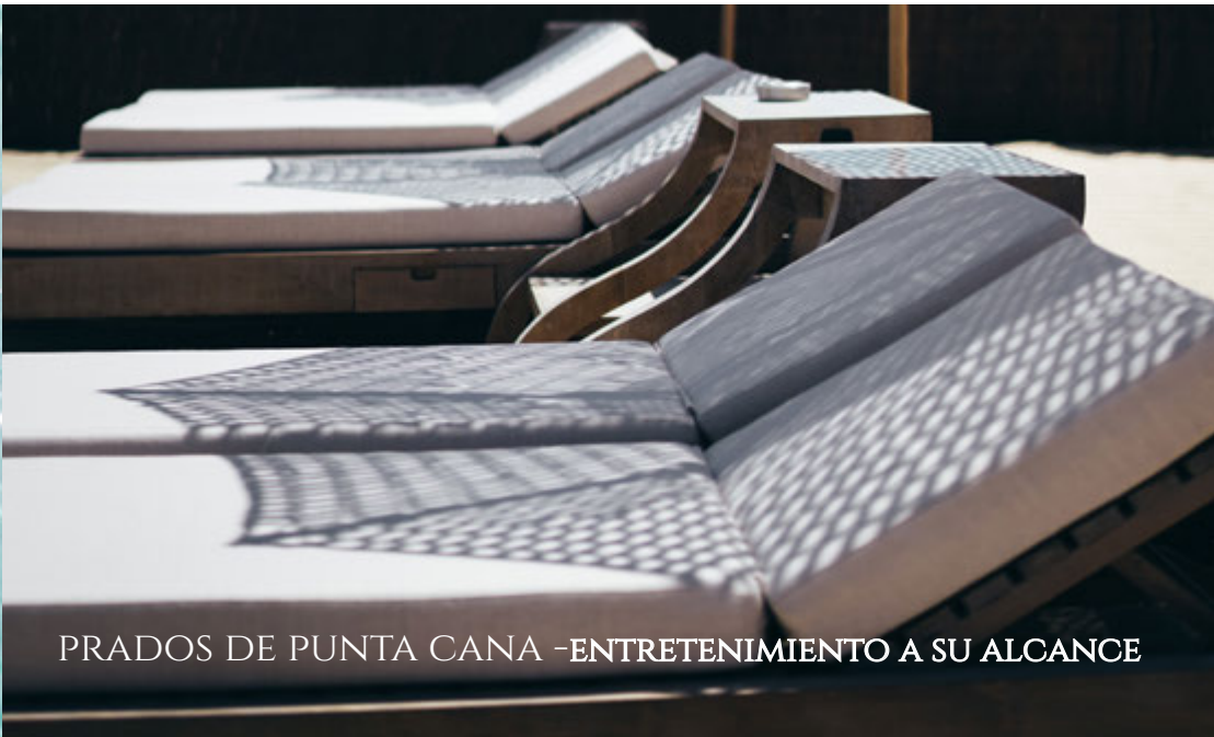
PRADOS DE PUNTA CANA -ENTRETENIMIENTO A SU ALCANCE