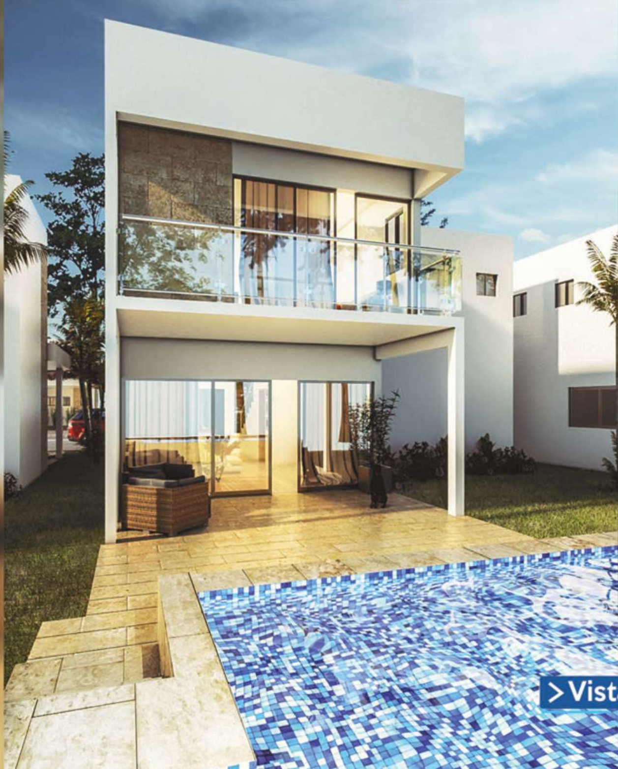
> Vista Trasera