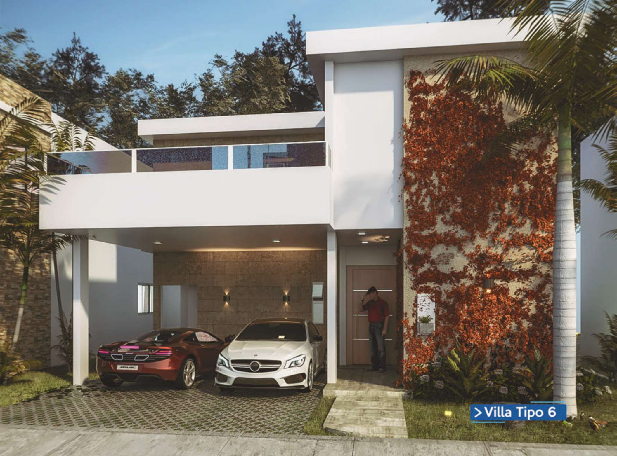
> Villa Tipo 6