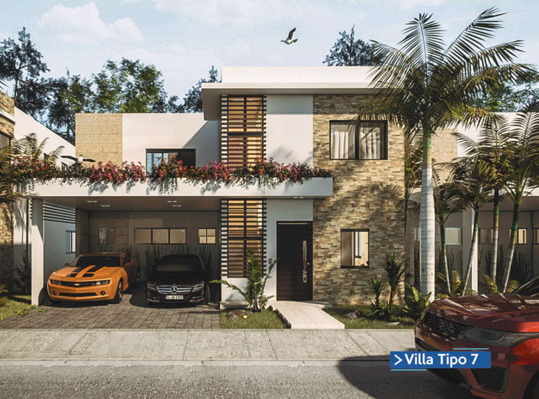
> Villa Tipo 7