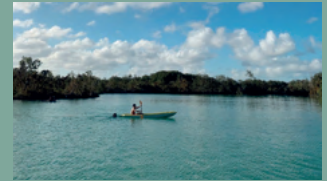
2. LAGO AZUL CAP CANA