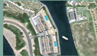
1. MARINA GARDEN