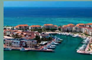
3. MARINA CAP CANA