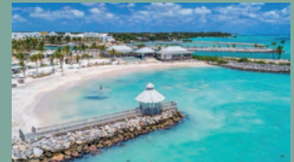
4. API BEACH