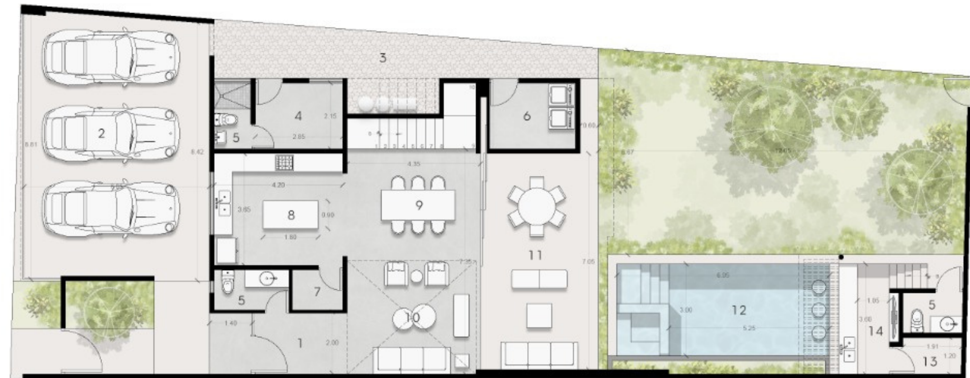
Planta Arquitectónica Baja