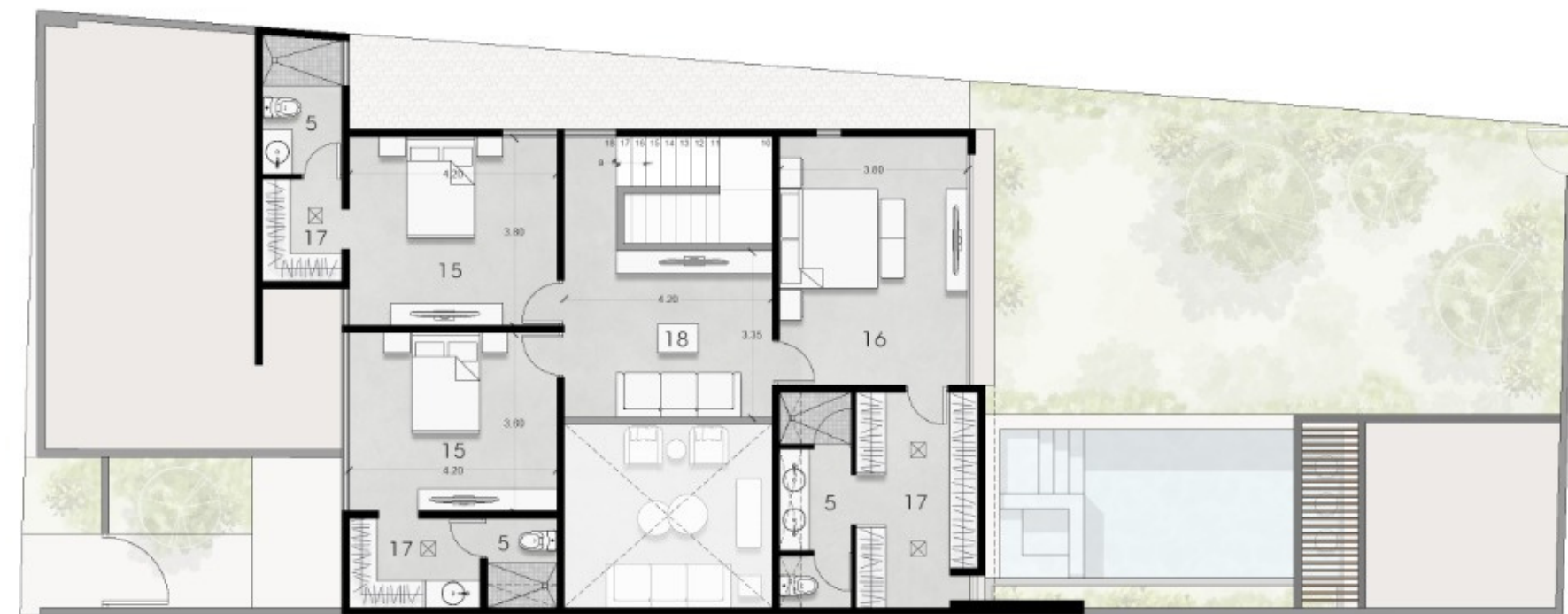
Planta Arquitectónica Baja