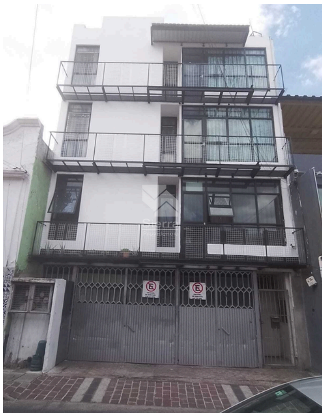
FACHADA RECIÉN PINTADA