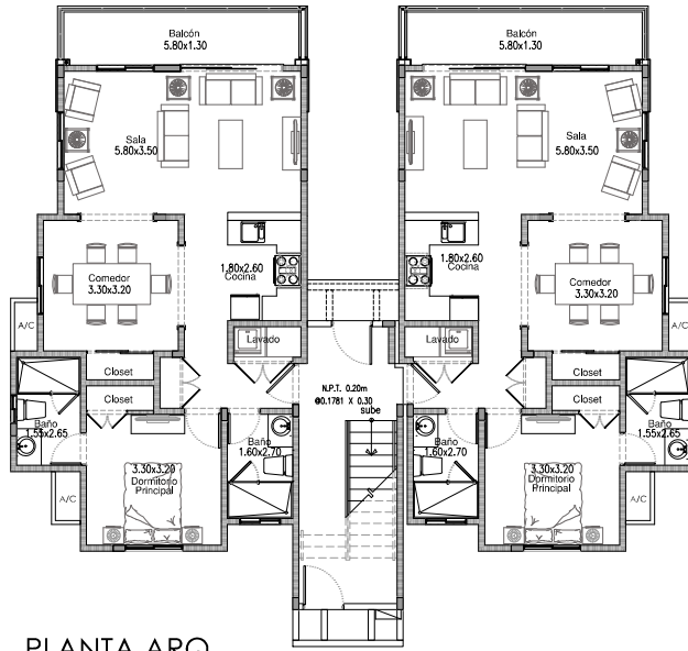
PLANTA ARQ. 1ER NIVEL