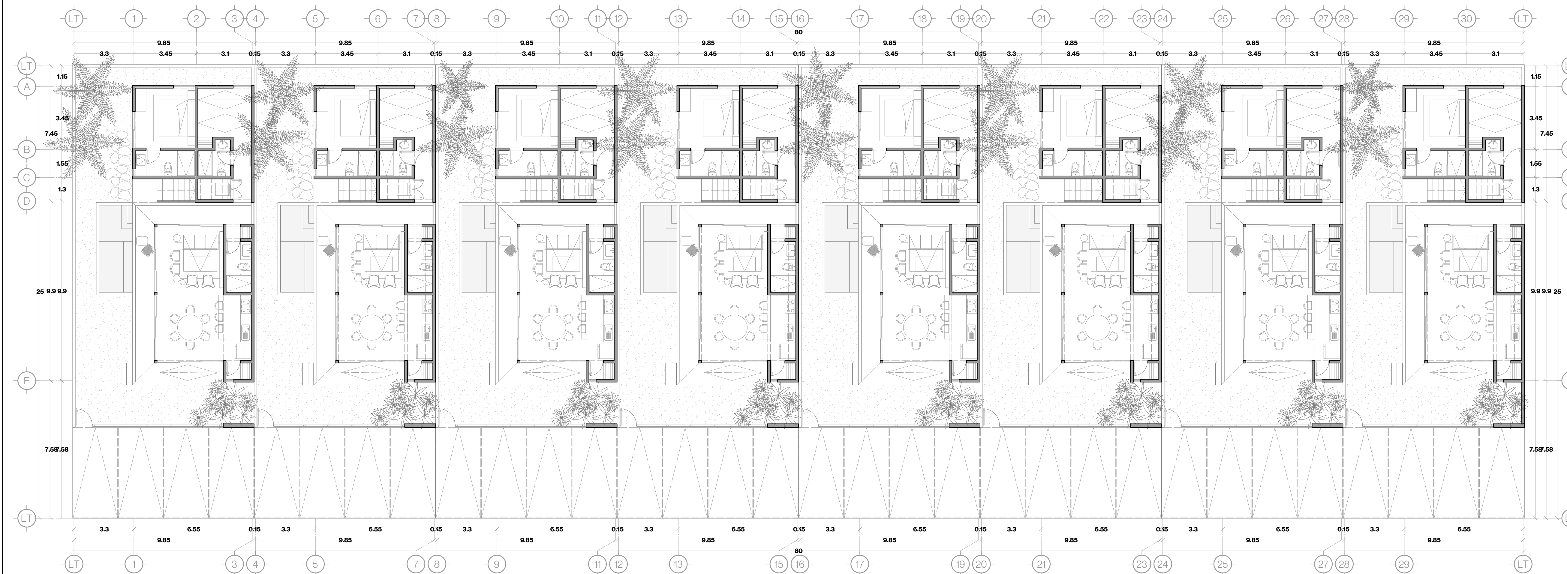
PLANTA CONJUNTO. PLANTA BAJA