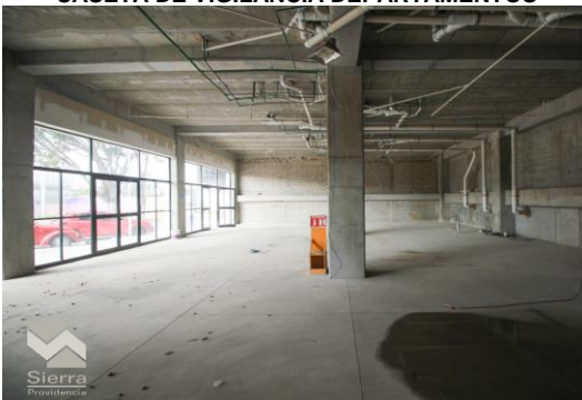
INERIOR LOCALES 3-5