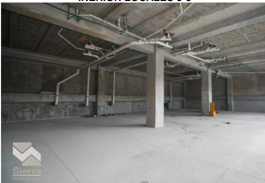
INERIOR LOCALES 3-5