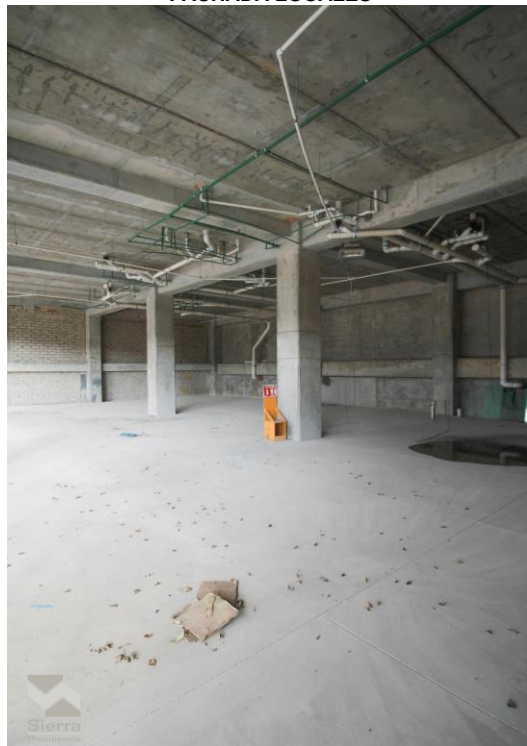
INERIOR LOCALES 3-5