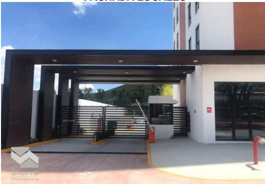
CASETA DE VIGILANCIA DEPARTAMENTOS