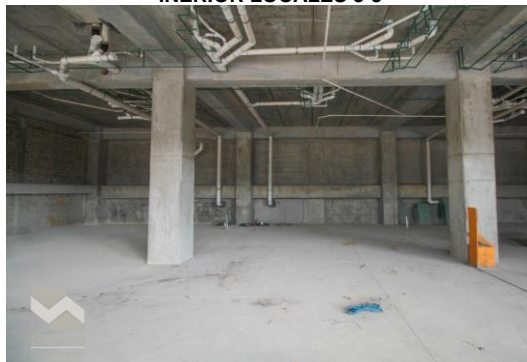
INERIOR LOCALES 3-5