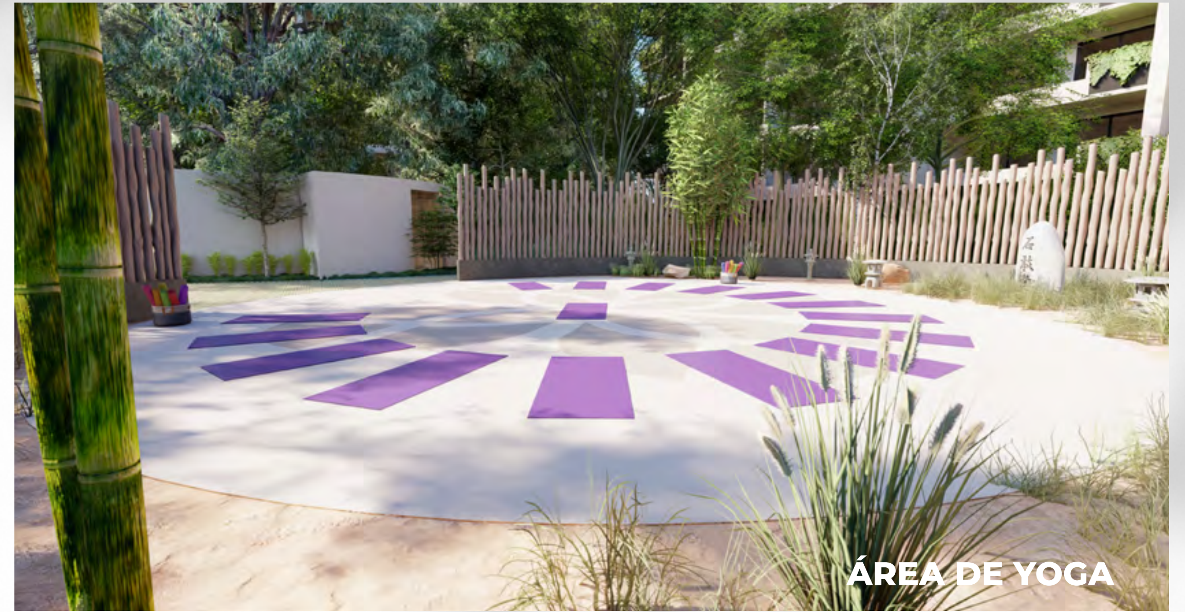
ÁREA DE YOGA