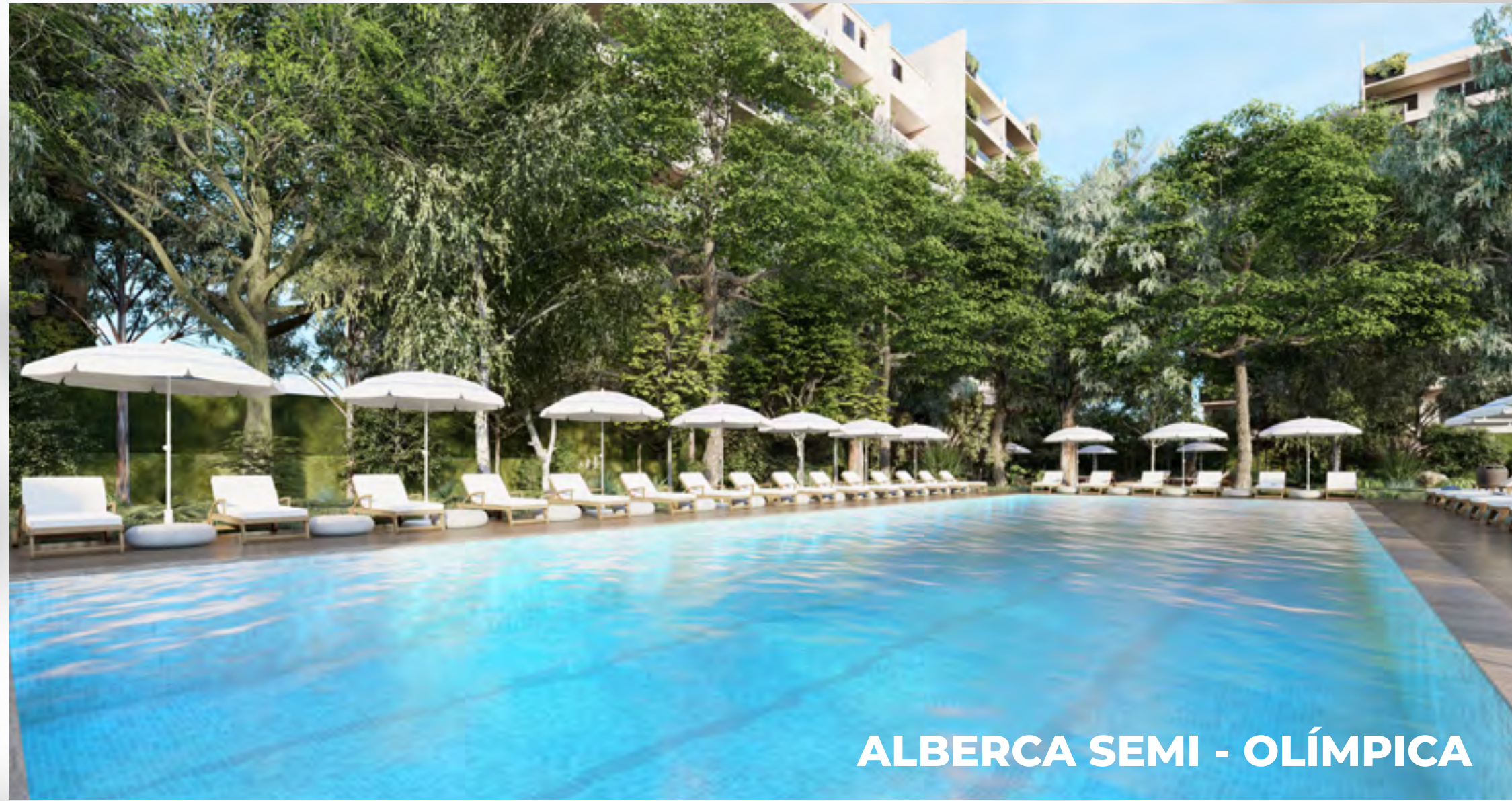
ALBERCA SEMI - OLÍMPICA