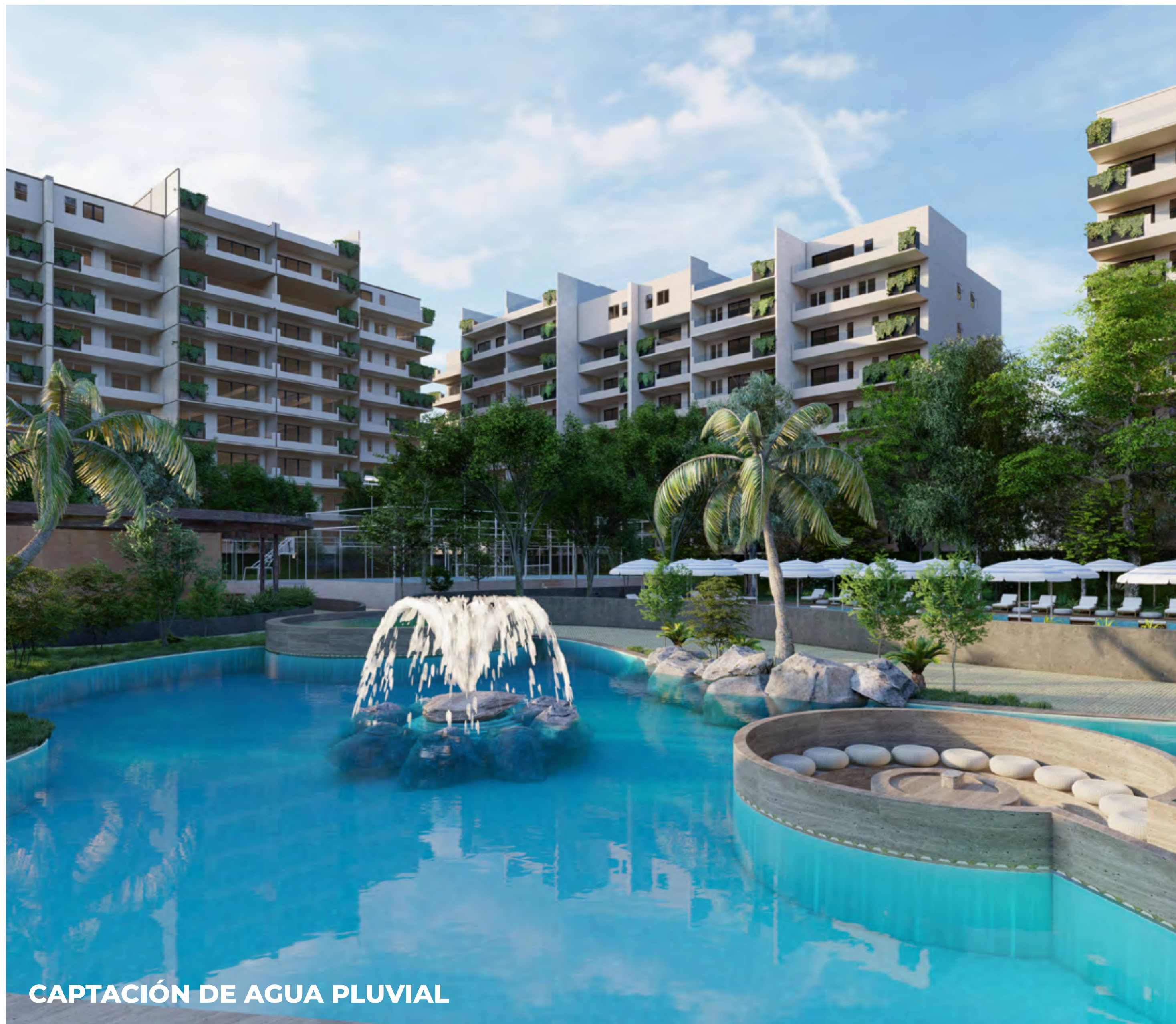
CAPTACIÓN DE AGUA PLUVIAL