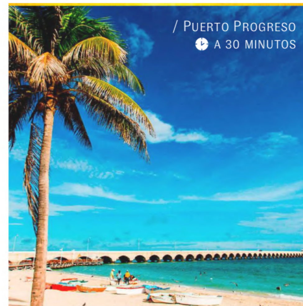
/ PUERTO PROGRESO A 30 MINUTOS