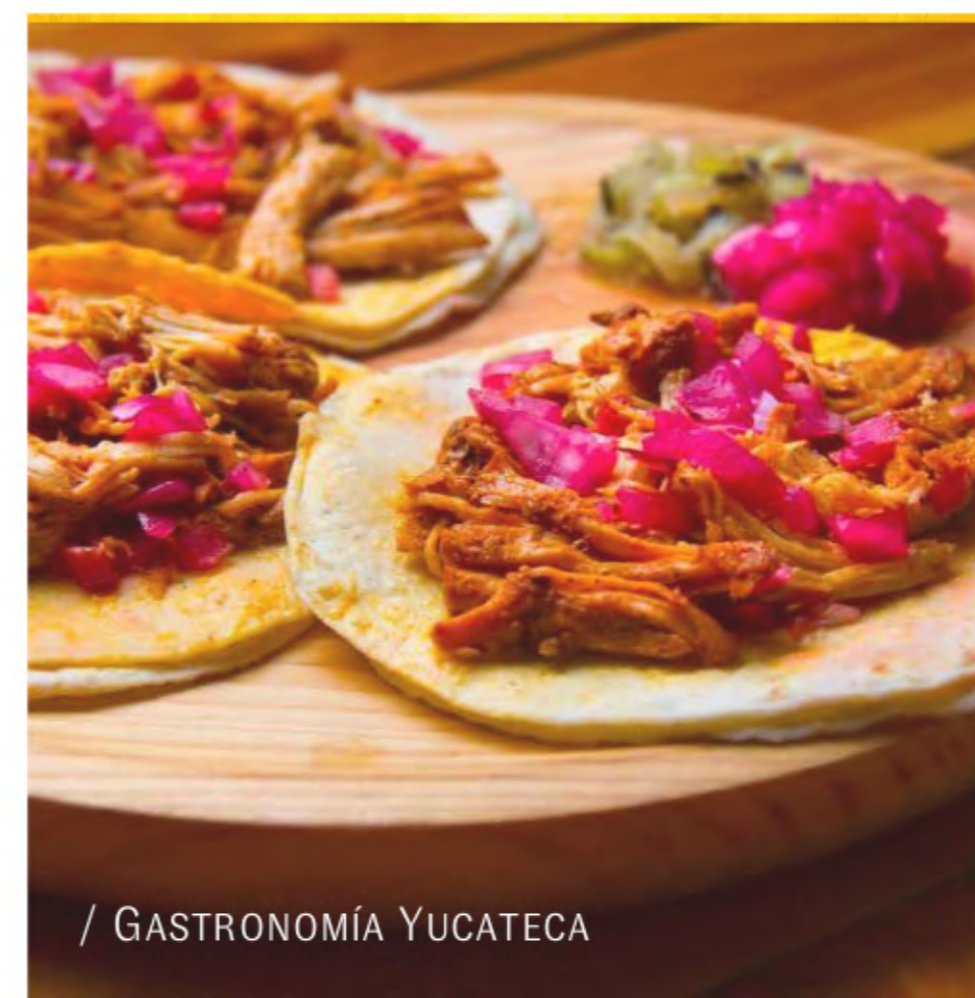
/ GASTRONOMÍA YUCATECA