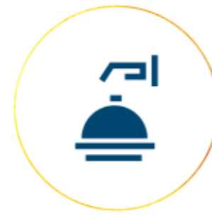
Lobby / Recepción