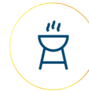
Área de Asadores