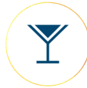
Bar / Terraza