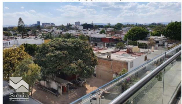
VISTA DEL DEPARTAMENTO