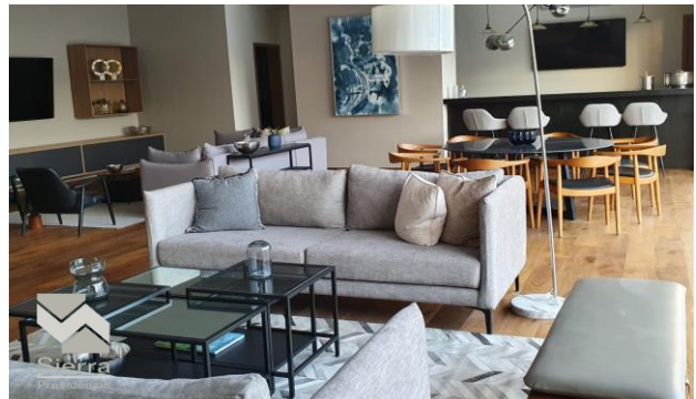
SALÓN DE ENTRETENIMIENTO