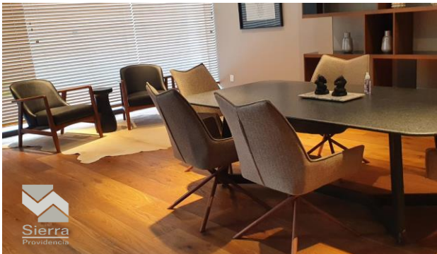
ÁREA DE COWORKING