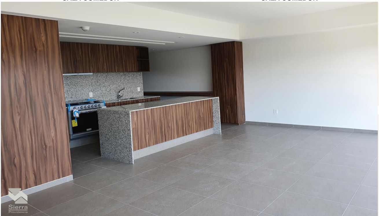
COCINA INTEGRAL CON BARRA