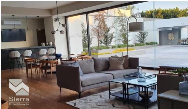
SALÓN DE ENTRETENIMIENTO