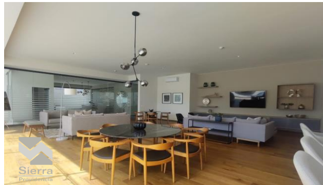
SALÓN DE ENTRETENIMIENTO