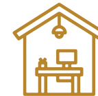
ÁREA PRIVADA DE HOME OFFICE