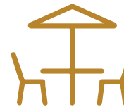
ROOF GARDEN COMÚN