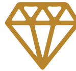
ACABADOS DE LUJO