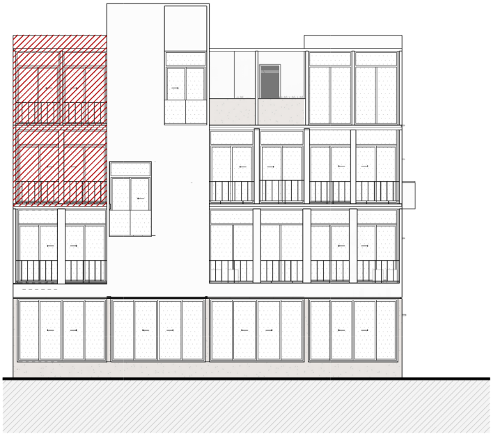
3 | ALZADO UBICACIONES ESCALA 1 : 200