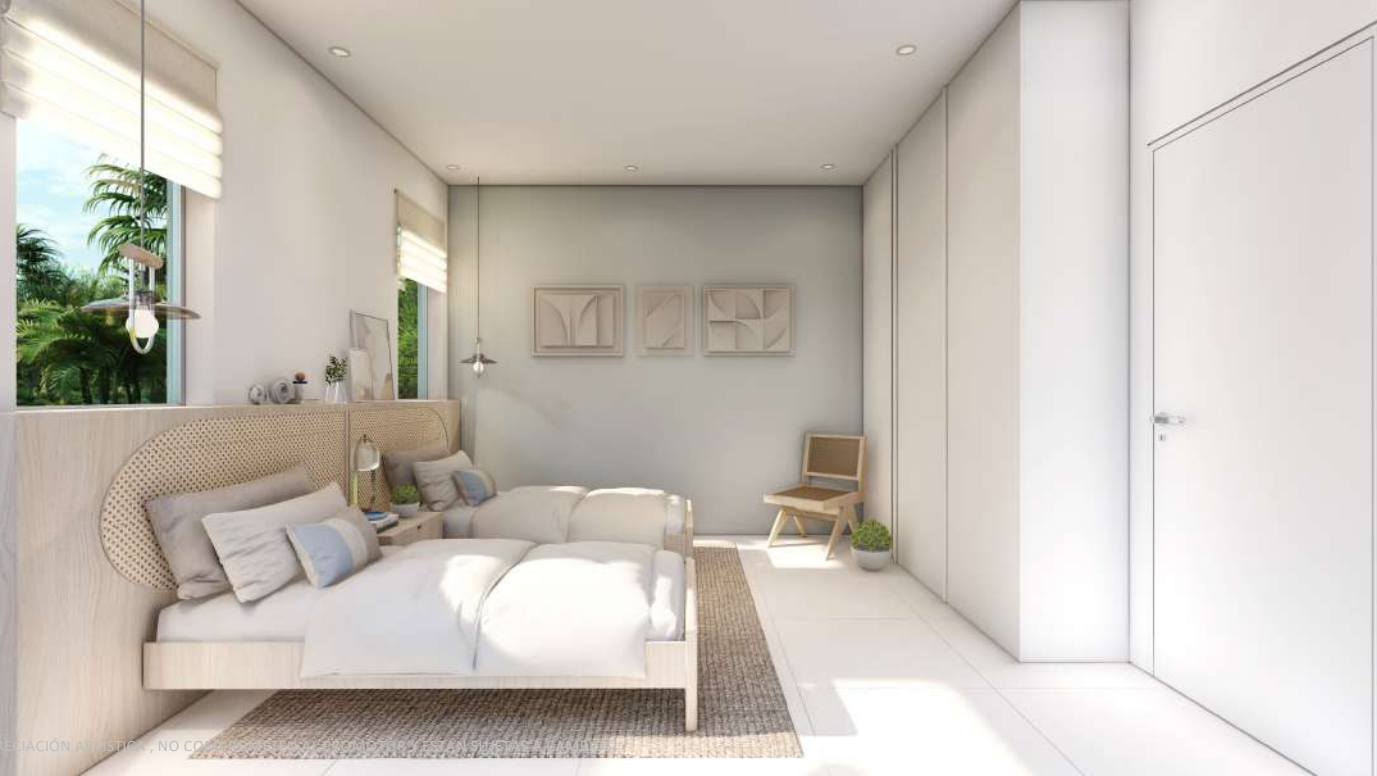
LAS IMÁGENES Y DISEÑOS ASÍ COMO LA AMBIENTACIÓN DEL MOBILIARIO SON DE CARÁCTER ILUSTRATIVO Y DE APLICACIÓN ARTÍSTICA, NO CONSTITUYEN UN COMPROMISO PARA EL CLIENTE.