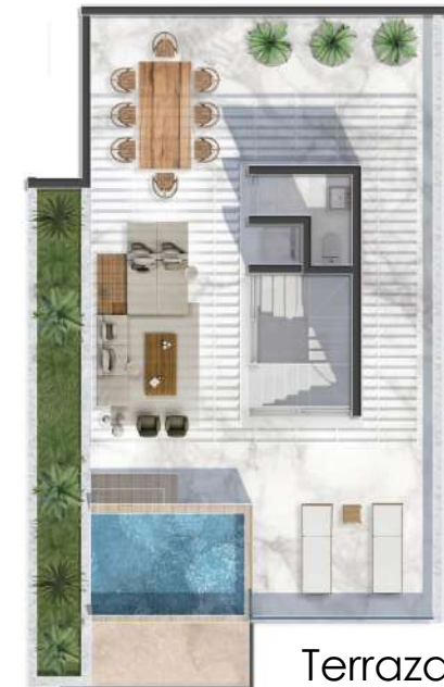
Terraza Nivel PH