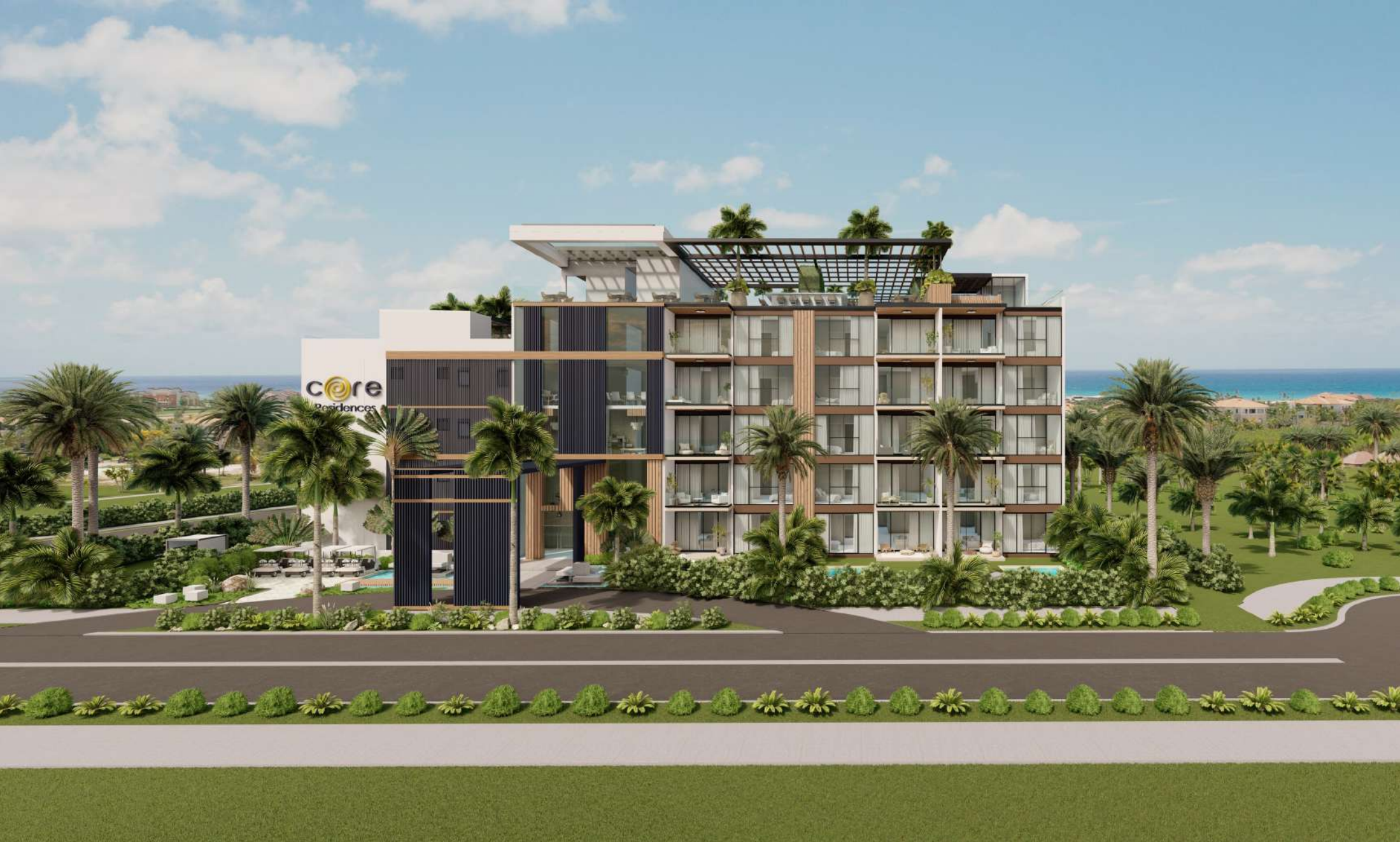
LAS IMÁGENES Y DISEÑOS ASÍ COMO LA AMBIENTACIÓN DEL MOBILIARIO SON DE CARÁCTER ILUSTRATIVO Y DE APRECIACIÓN ARTÍSTICA , NO COMPROMETEN AL PROMOTOR Y ESTÁN SUJETAS A CAMBIOS.