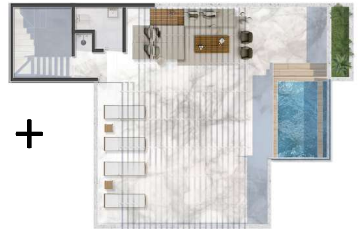
Terraza Nivel PH