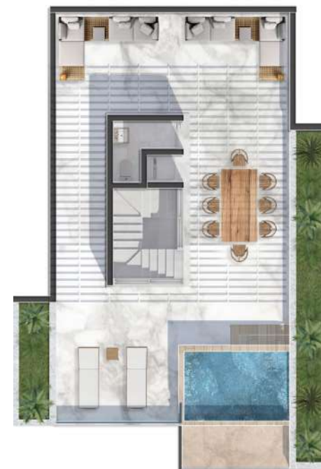
Terraza Nivel PH