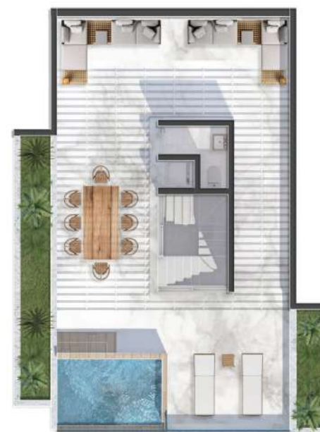
Terraza Nivel PH