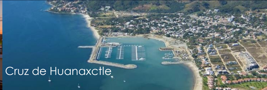
Cruz de Huanaxctle