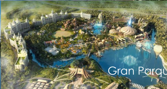
Gran Parque CIRC DU SOLEIL