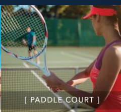
[ PADDLE COURT ]