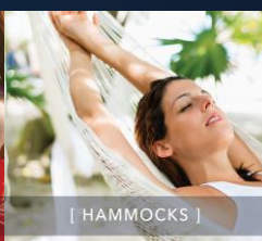
[ HAMMOCKS ]