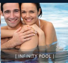
[ INFINITY POOL ]