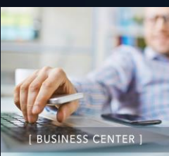
[ BUSINESS CENTER ]