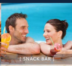
[ SNACK BAR ]