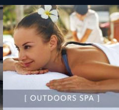
[ OUTDOORS SPA ]