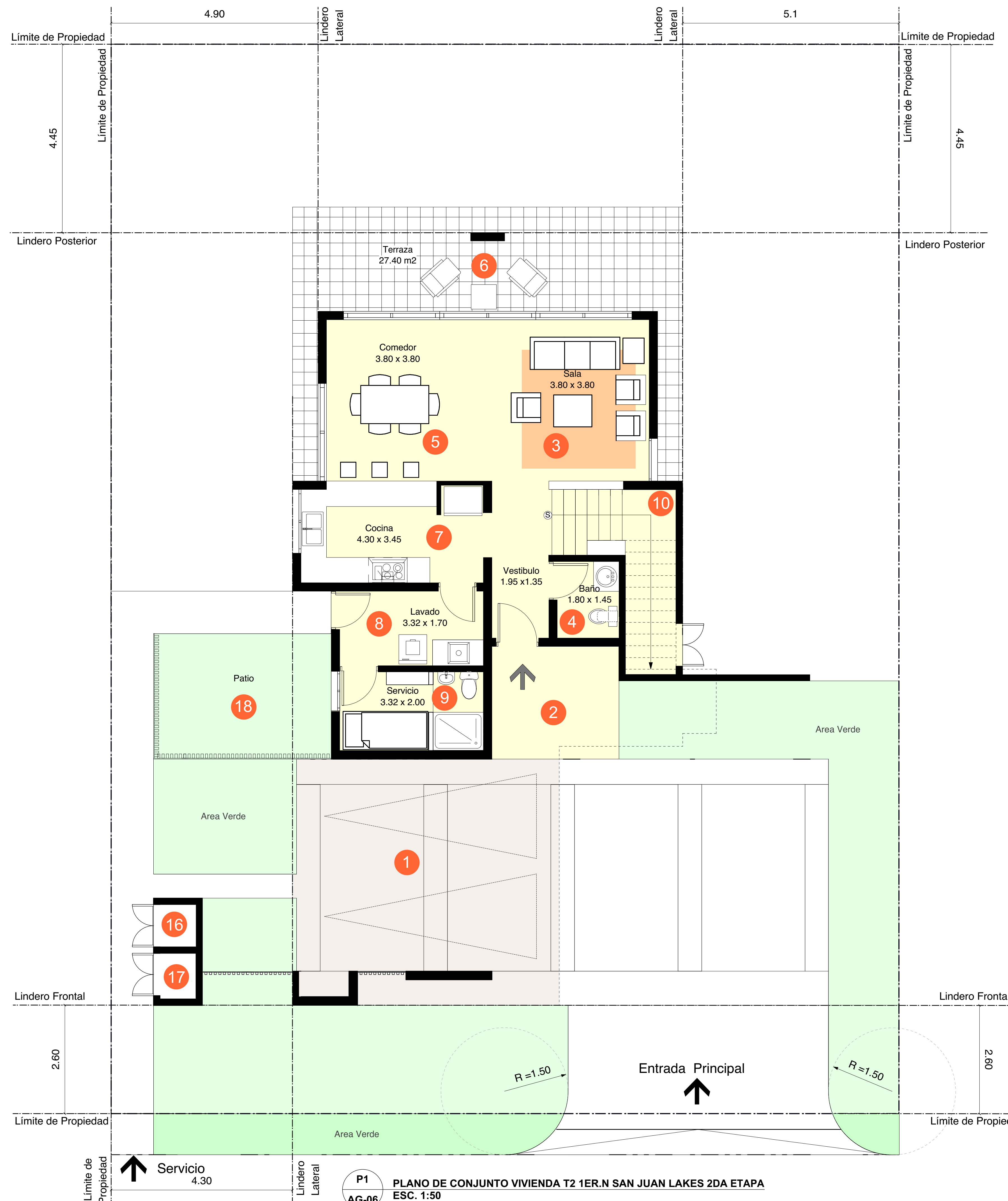
P1 AG-06 PLANO DE CONJUNTO VIVIENDA T2 1ER.N SAN JUAN LAKES 2DA ETAPA ESC. 1:50