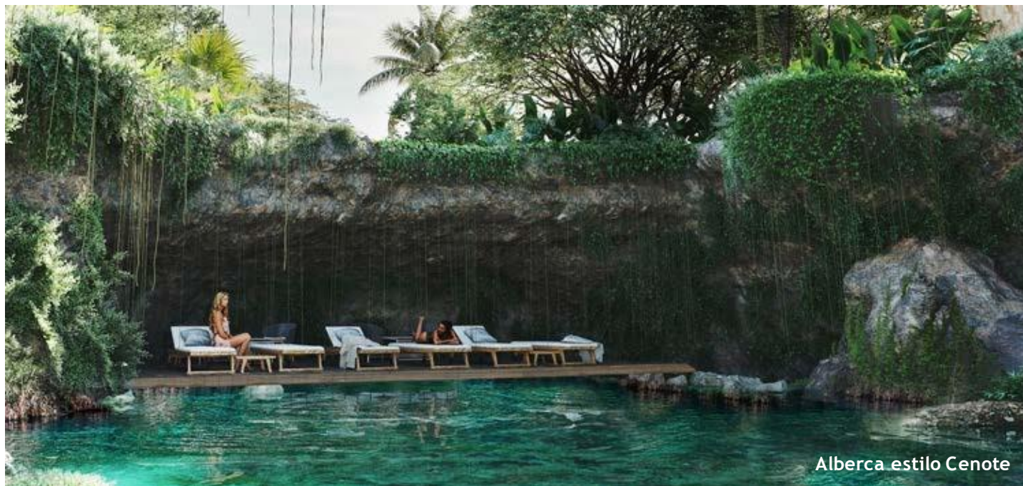
Alberca estilo Cenote