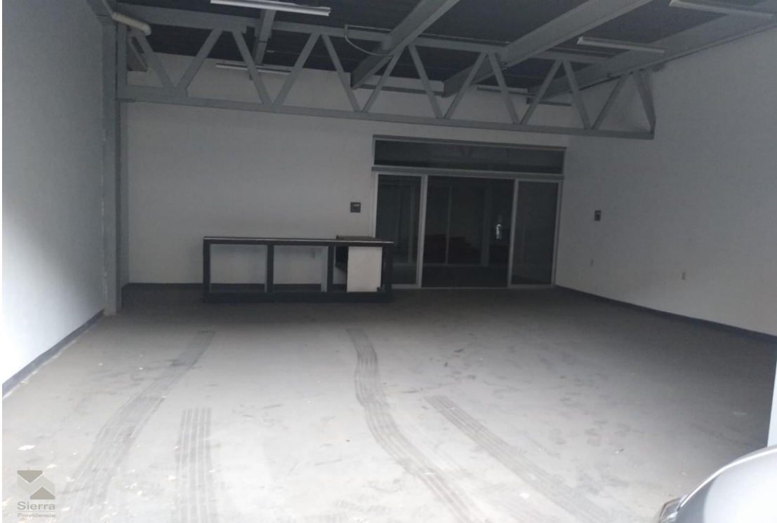
LOCAL INDEPENDIENTE PARA CARGA Y DESCARGA