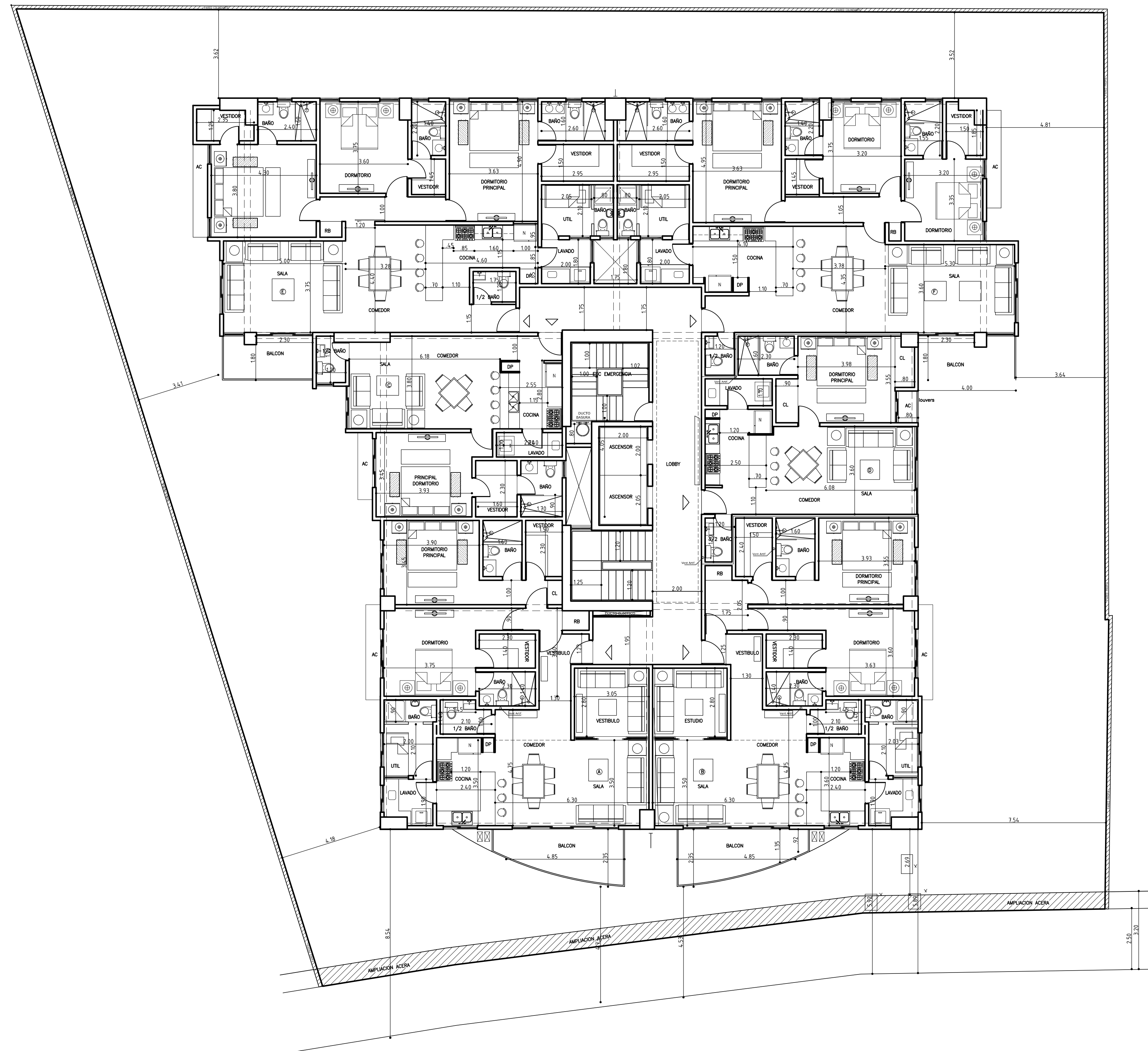
Planta Amueblada Tipo 3ro-13vo