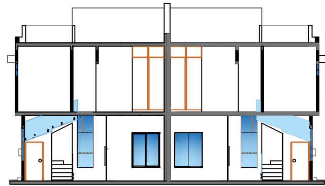
Seccion longitudinal Esc. 1:50