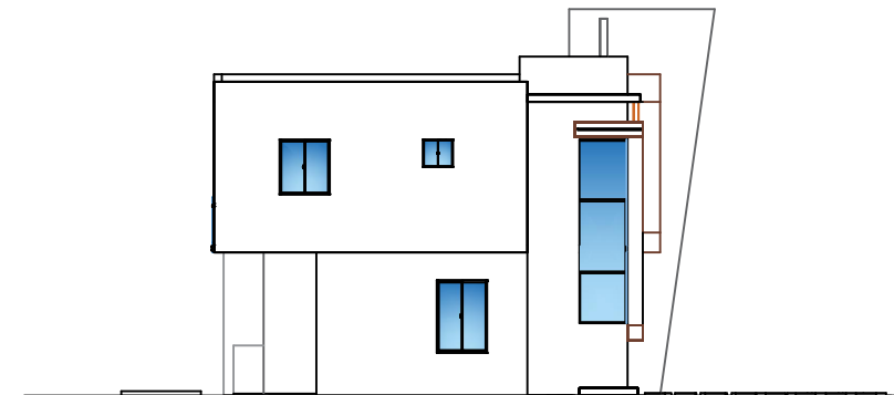
Elevacion Lateral Izquierda. Esc. 1:50

ING. WILLY R. ALBUQUERQUE J. DISEÑO / EJECUCION CONSULTORIA PROYECTOS EN GRAL. LOS CORALES P.C La Altagracia, R.D.