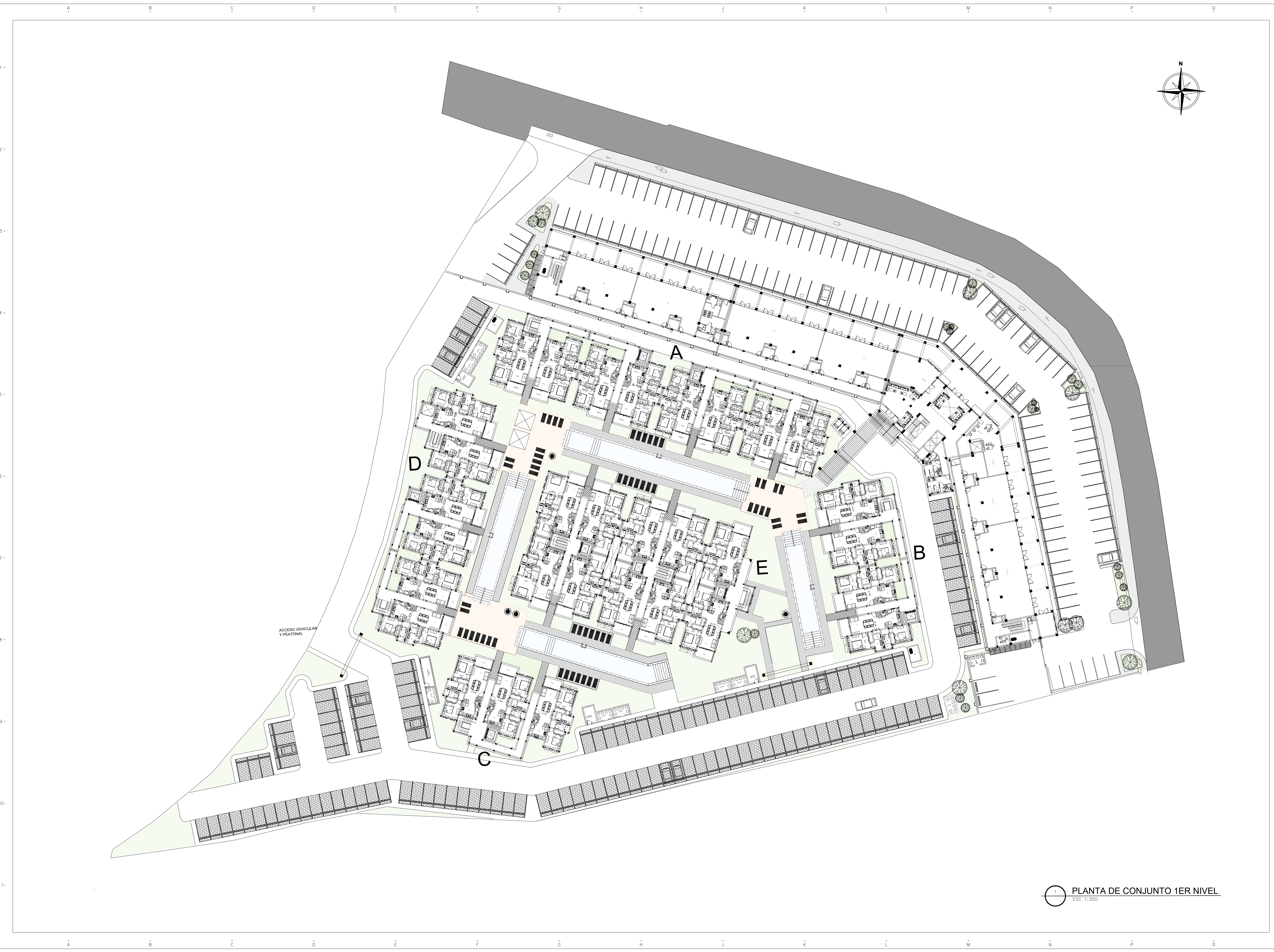
PLANTA DE CONJUNTO 1ER NIVEL ESC 1:350