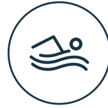
Piscina y asoleadero