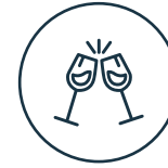
Salón de eventos