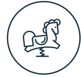
Área de juegos infantiles