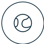
Cancha de pádel