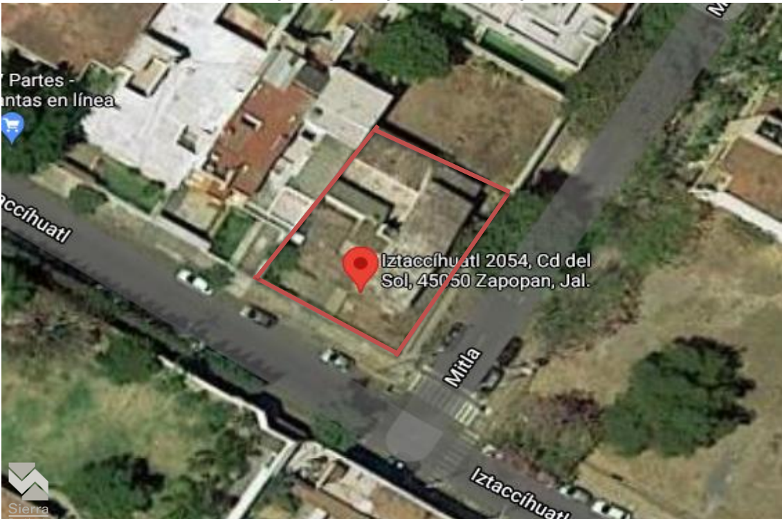
VISTA AÉREA DEL TERRENO