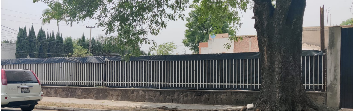
VISTA AL TERRENO DESDE LA CALLE