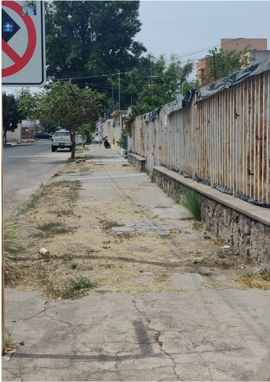
VISTA DESDE LA CALLE AL TERRENO