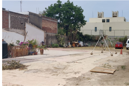
VISTA AL TERRENO DESDE LA CALLE