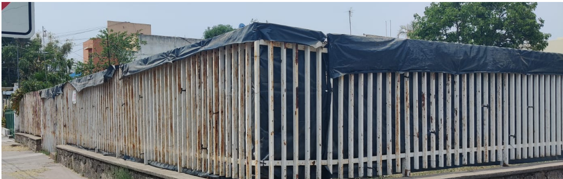
VISTA DESDE LA CALLE AL TERRENO