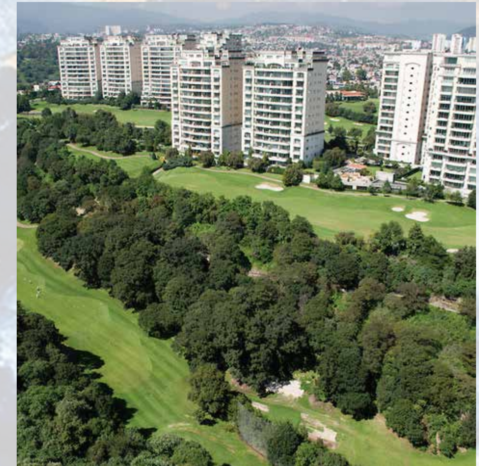
Club de golf: Bosques CDMX