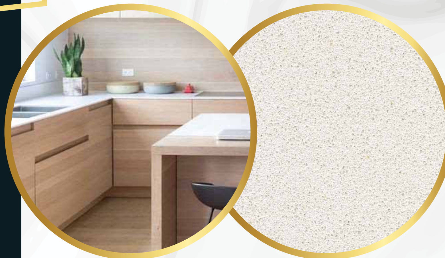
Cubierta de cuarzo en cocina