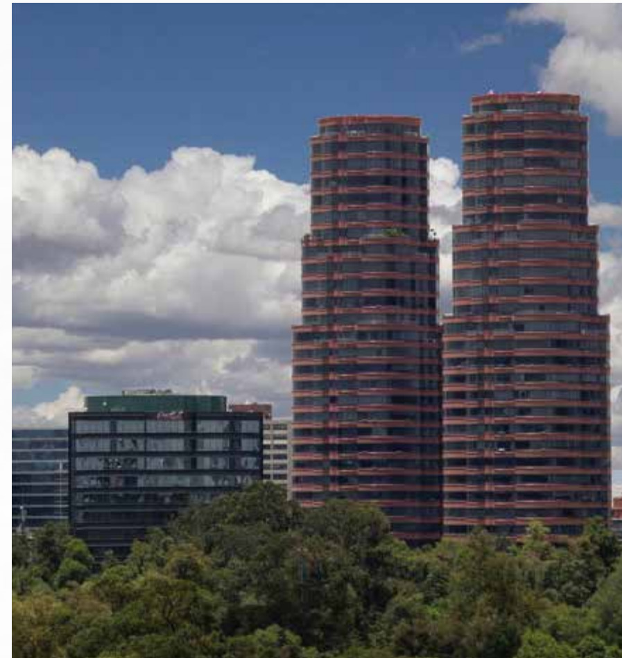
Residencial del Bosque CDMX

Nos esforzamos para que nuestros desarrollos cumplan con las exigencias más altas del mercado y se encuentren en una ubicación privilegiada y de fácil acceso a servicios comerciales, espacios recreativos y familiares.