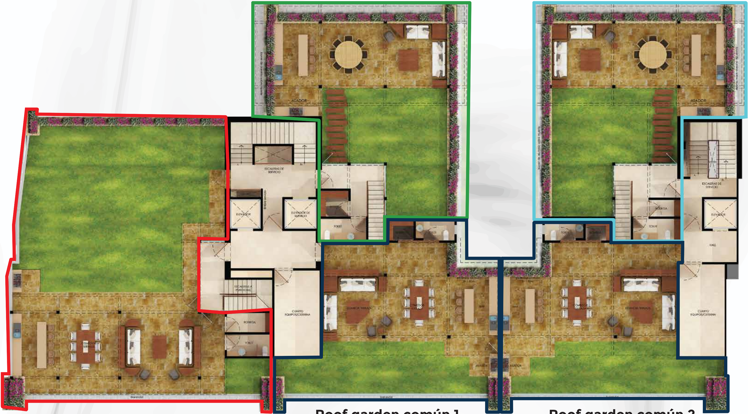
Roof garden común 1