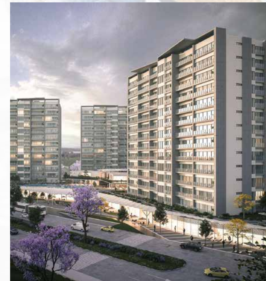
Álada Valle Rea Zapopan Jalisco