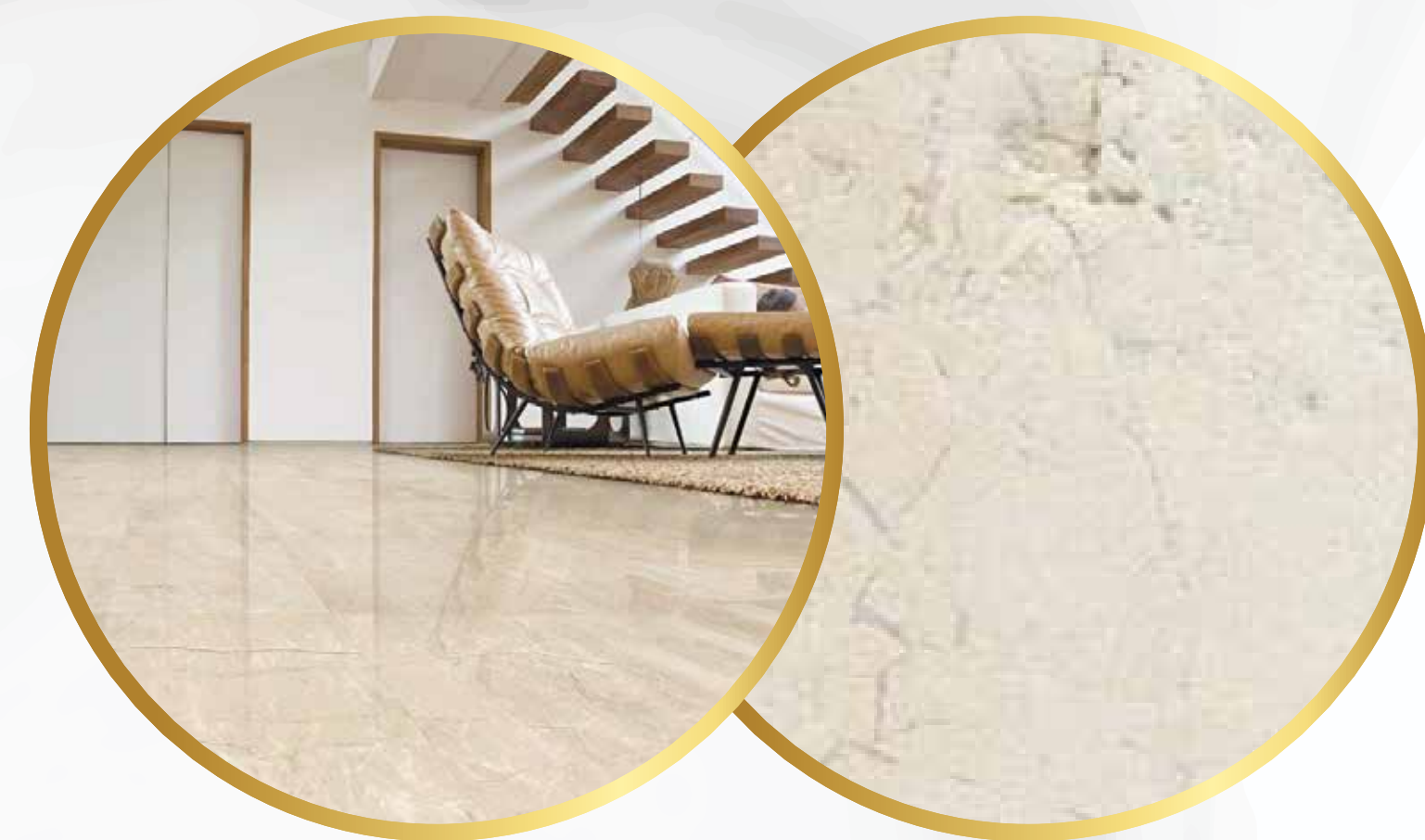
Piso de mármol Galala crema marfil en estancia