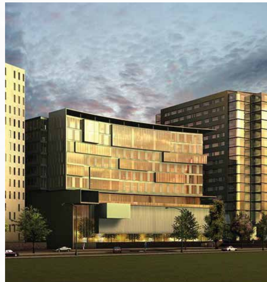
Parques Polanco CDMX