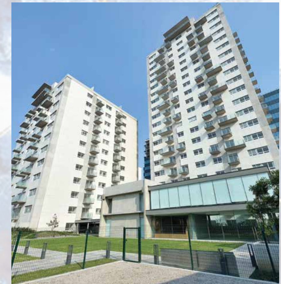
Parques Plaza Nuevo Polanco CDMX