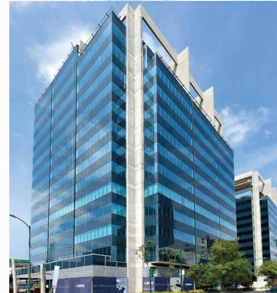
Oficinas Parques Plaza Nuevo Polanco CDMX