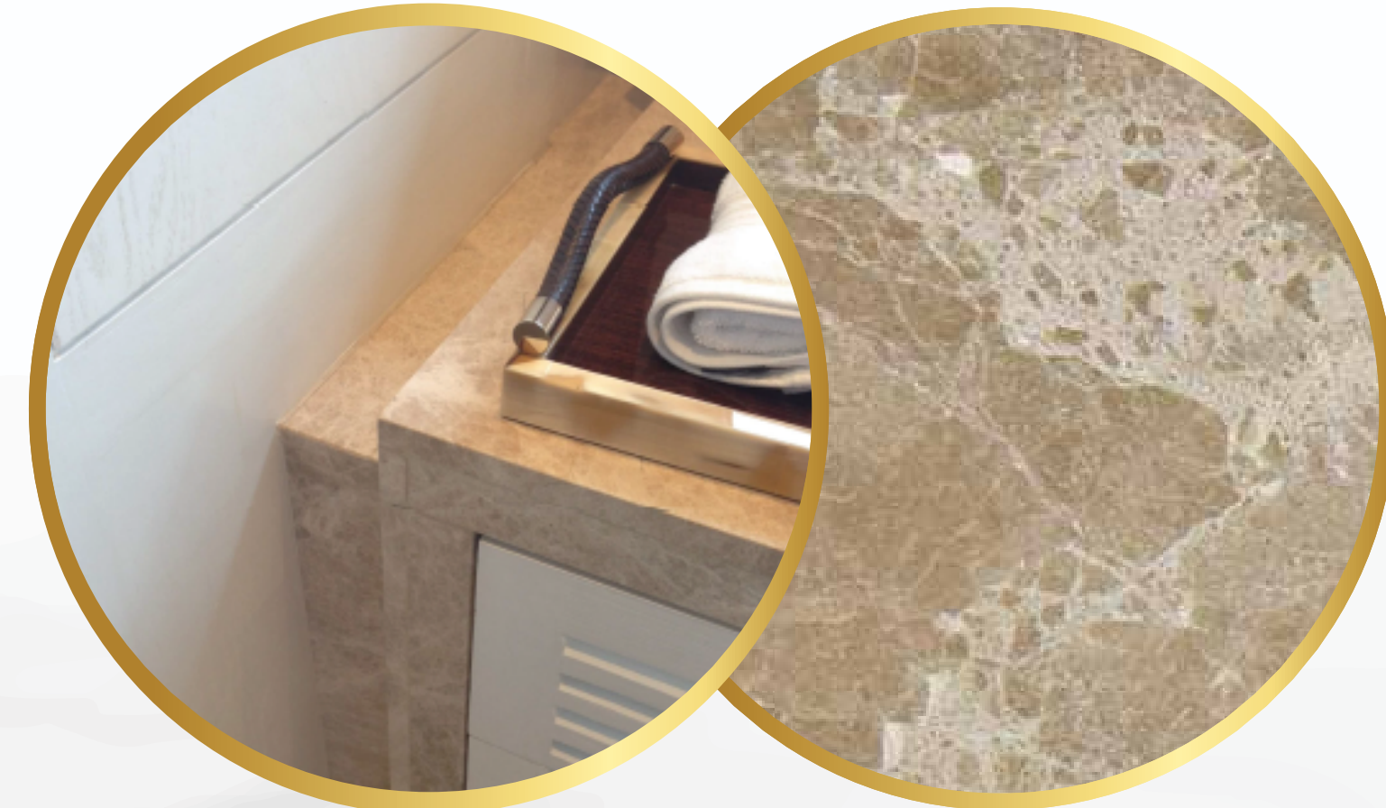
Mármol Emperador Light en cubiertas de baños y regaderas