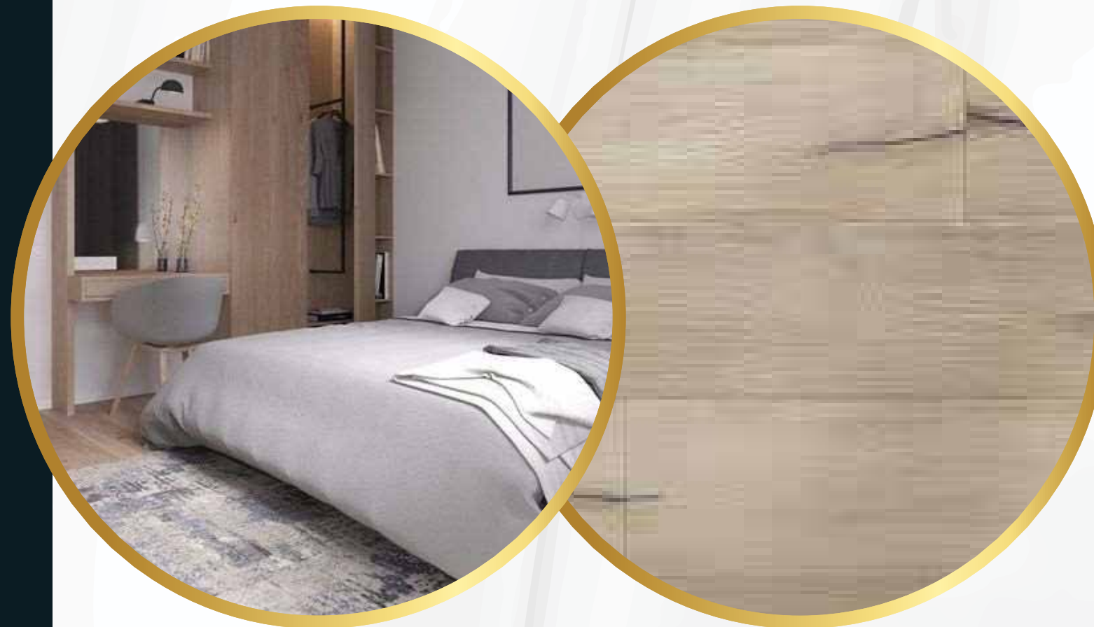
Piso de madera de ingeniería en recámaras y family room