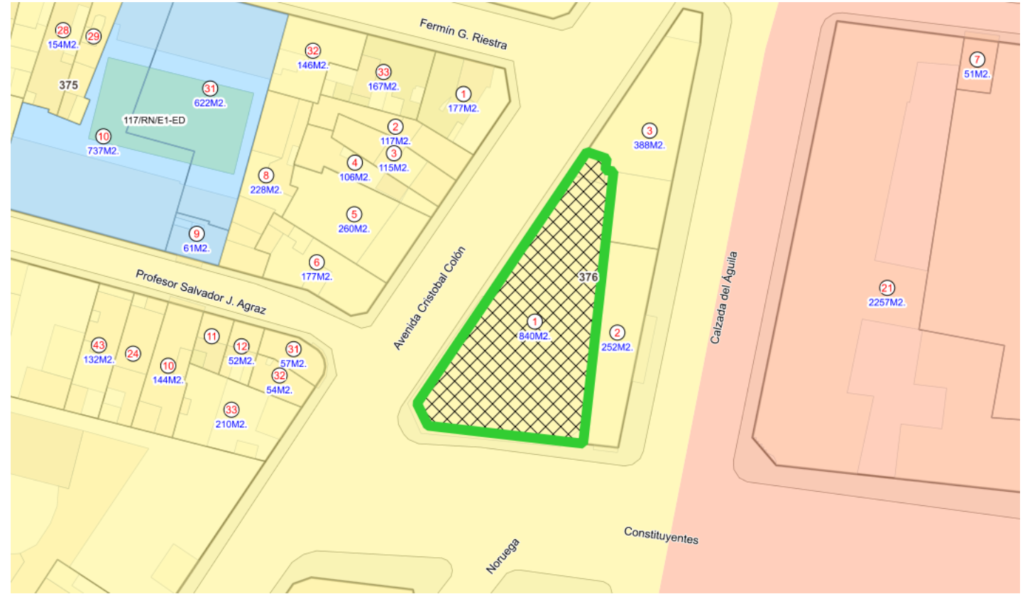
Croquis de Predio