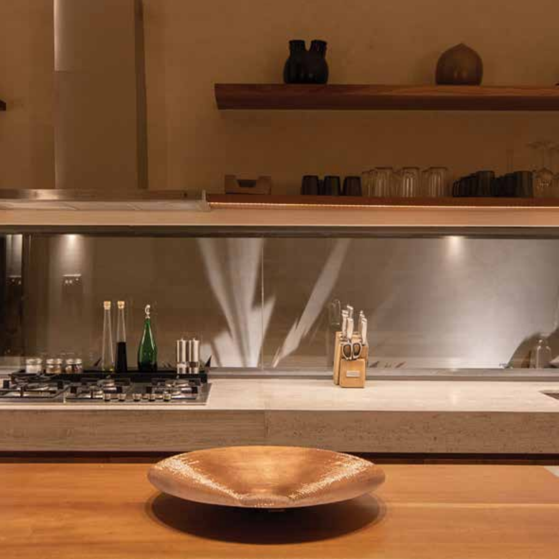
Diseños y materiales que realzan la arquitectura de la península, creando espacios únicos.