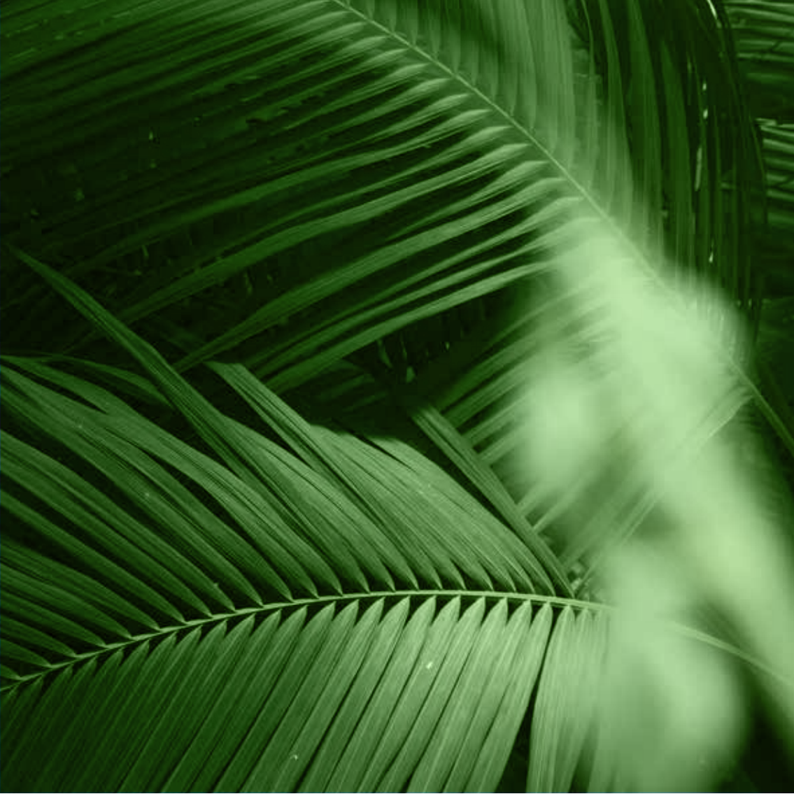
Espacios privados que convergen con patios y zonas jardinadas.