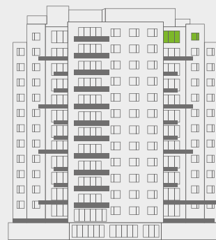
Vista: La Reserva