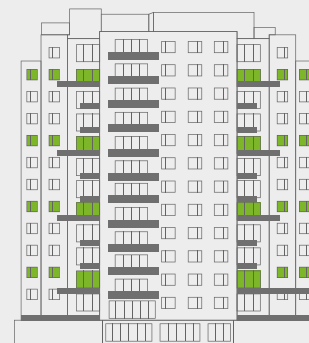
Vista: La Reserva