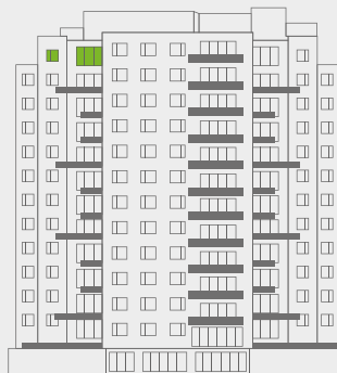
Vista: Paseo Querétaro