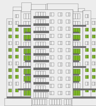
Vista: La Reserva