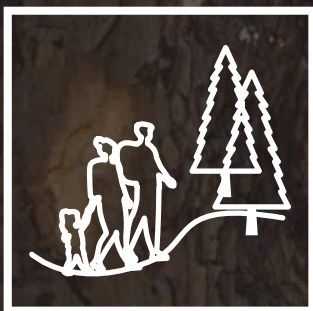
Camino de senderismo