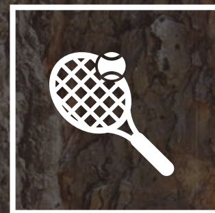
Canchas de Tenis