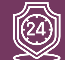
Seguridad, atención y vigilancia 24 Hrs