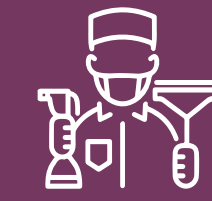
Servicio de limpieza y lavanderías