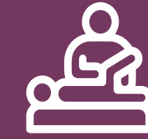
Fisioterapia y rehabilitación