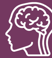
Actividades de estimulación cognitiva