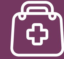
Asistencia médica dentro y fuera del complejo