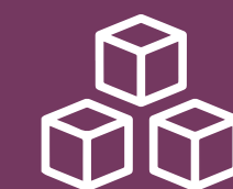
Salas de usos múltiples