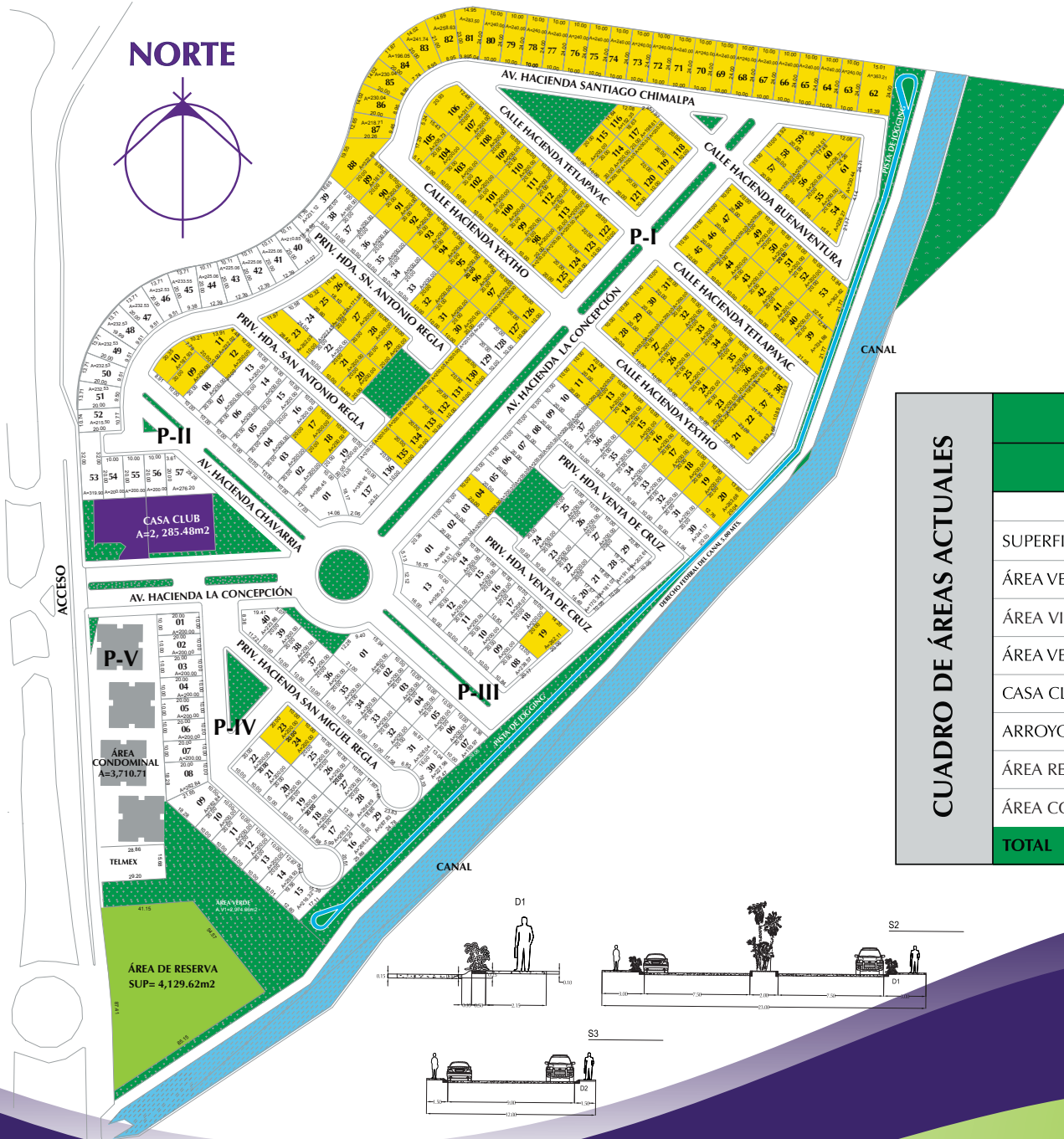
CUADRO DE ÁREAS ACTUALES