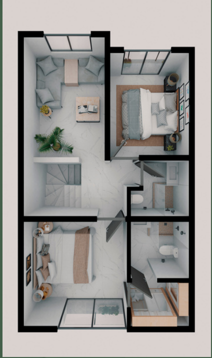
PRIMER NIVEL 52.23 M2