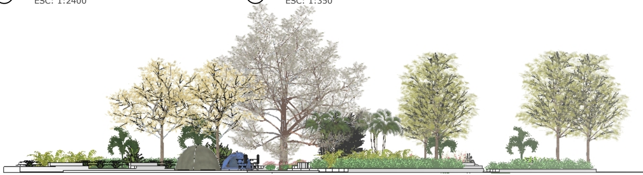
ELEV A ESC: 1:250