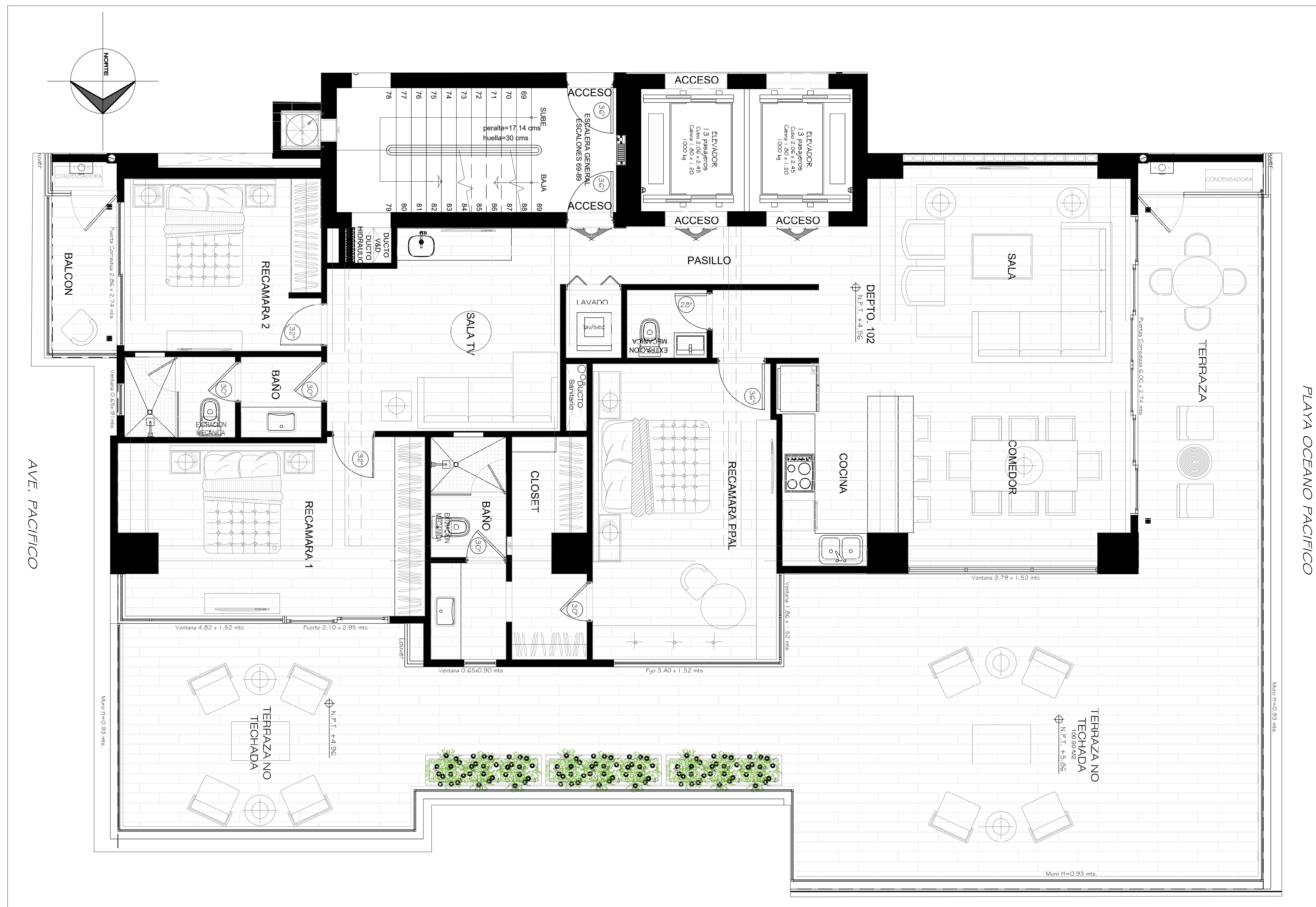
PLANTA ARQUITECTONICA TIPO DEPTO. GH2