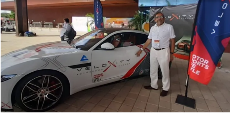
Yucatán contará con un nuevo autódromo y se llamará Velocity