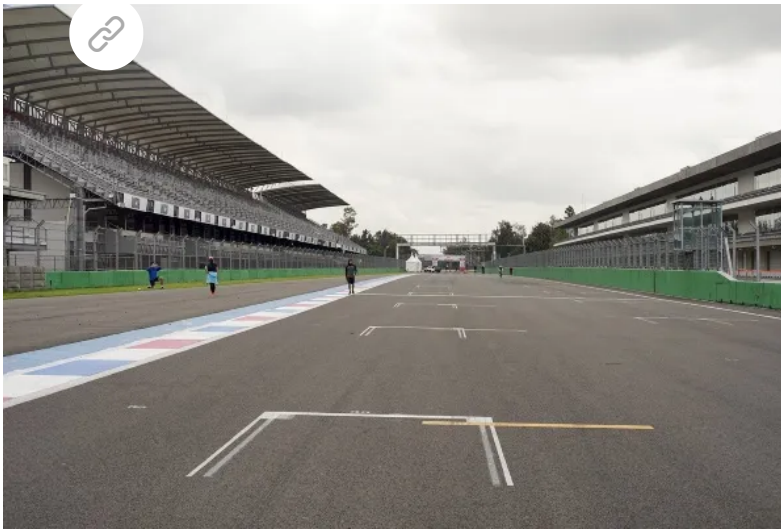
En el nuevo autódromo se podrán practicar varias disciplinas del deporte motor.

Además, contará con un campo de golf, campo de tiro para arma corta, larga, arco y flecha, así como un espacio para practicar paracaidismo, aunado a que se prevé la edificación de un centro comercial, restaurantes y bares.