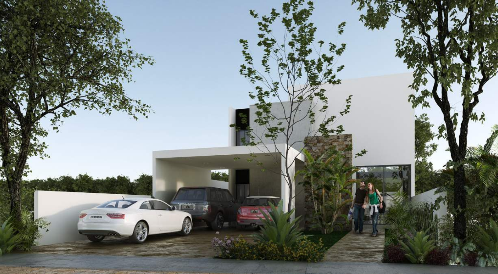
Modelo C | Fachada