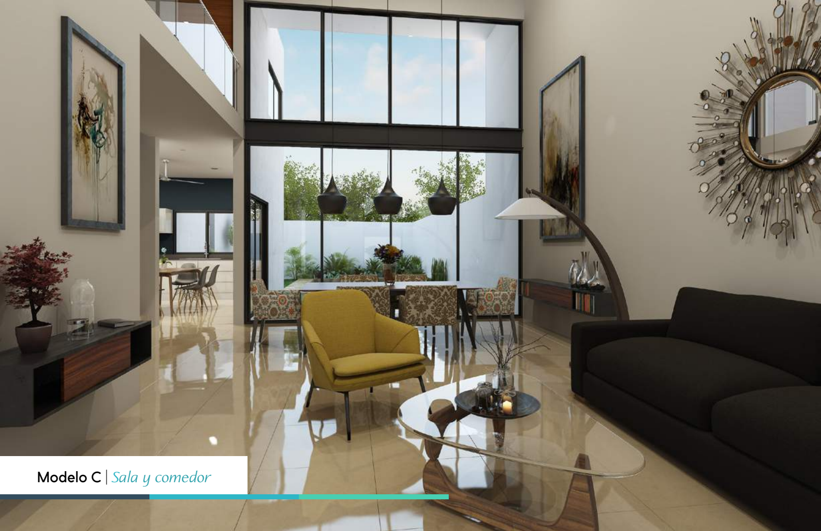
Modelo C | Sala y comedor