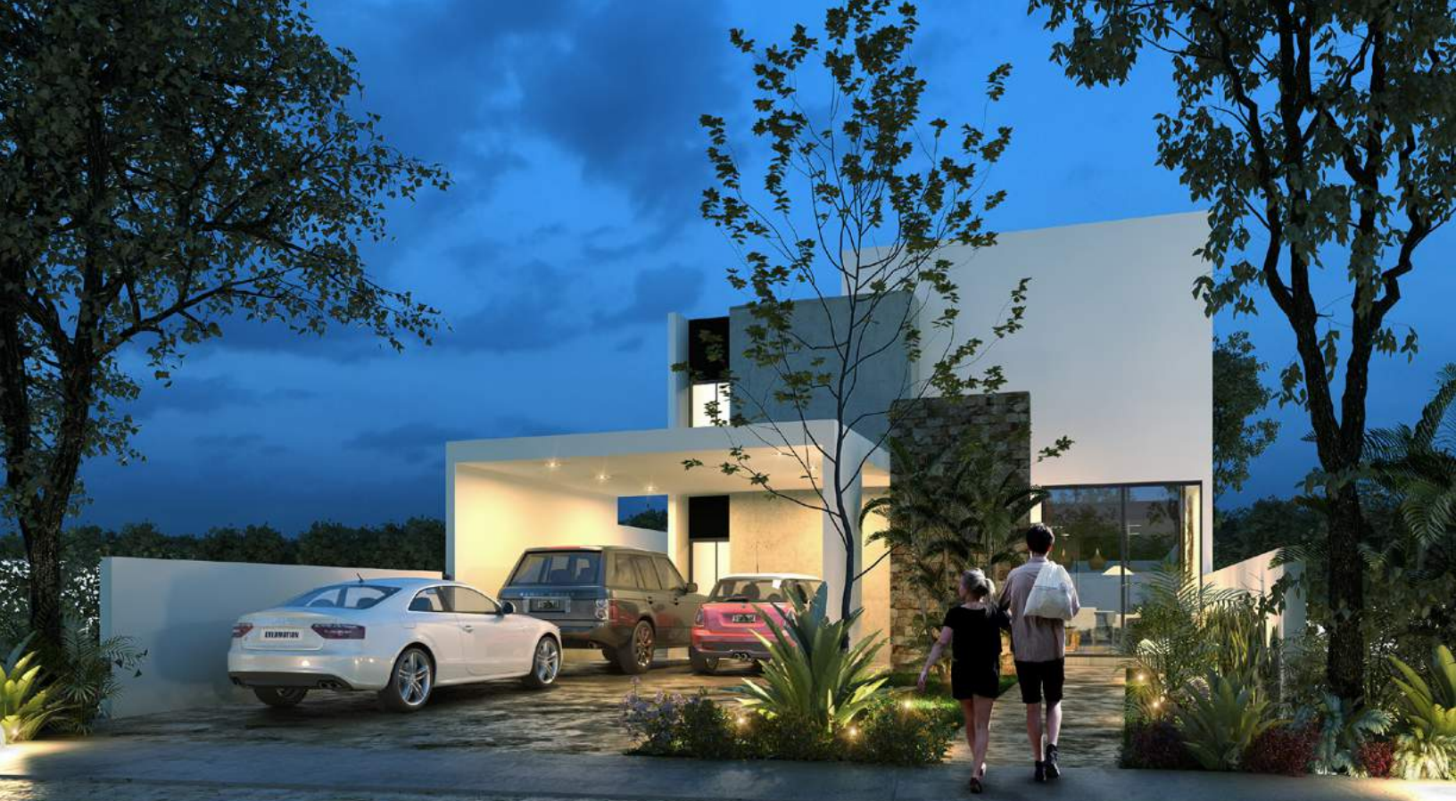
Modelo C | Fachada