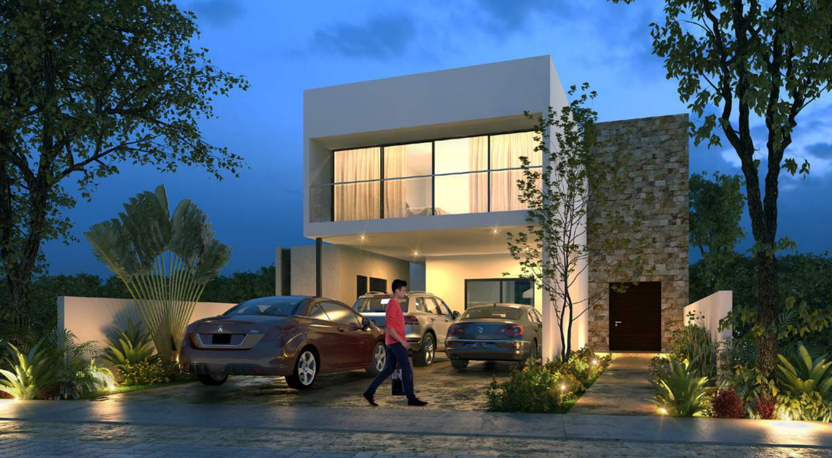
Modelo D | Fachada