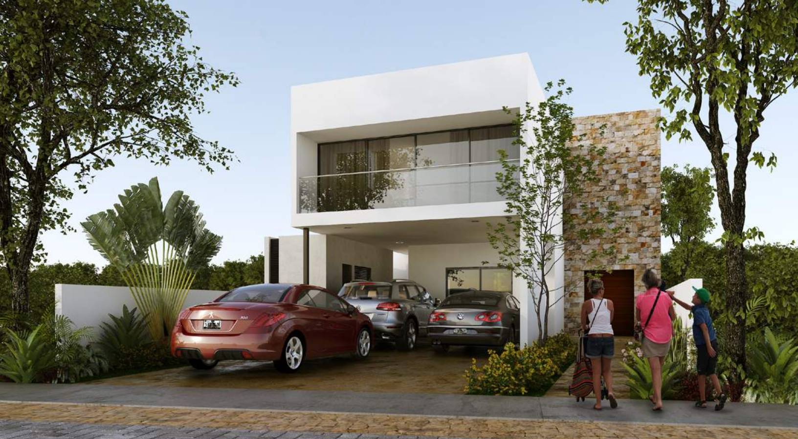
Modelo D | Fachada