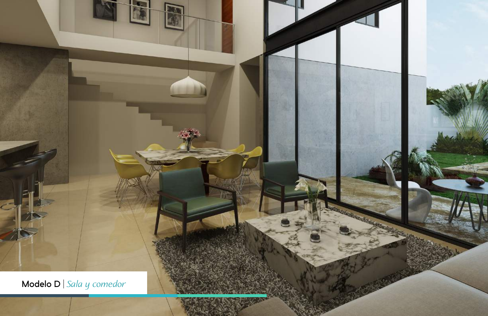
Modelo D | Sala y comedor