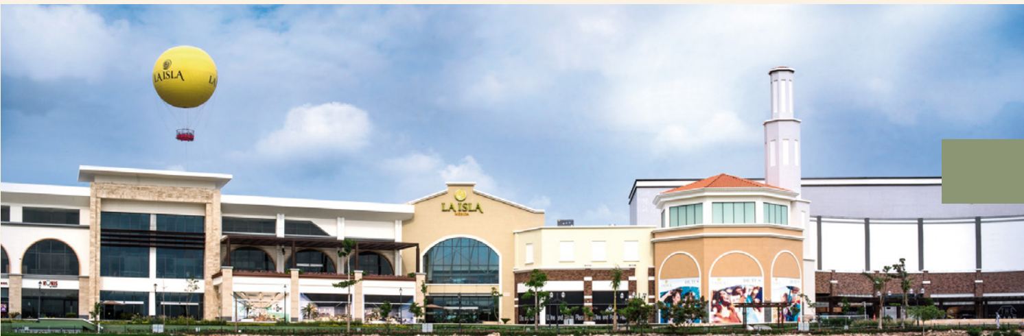
15 minutos de las principales plazas y hospitales.