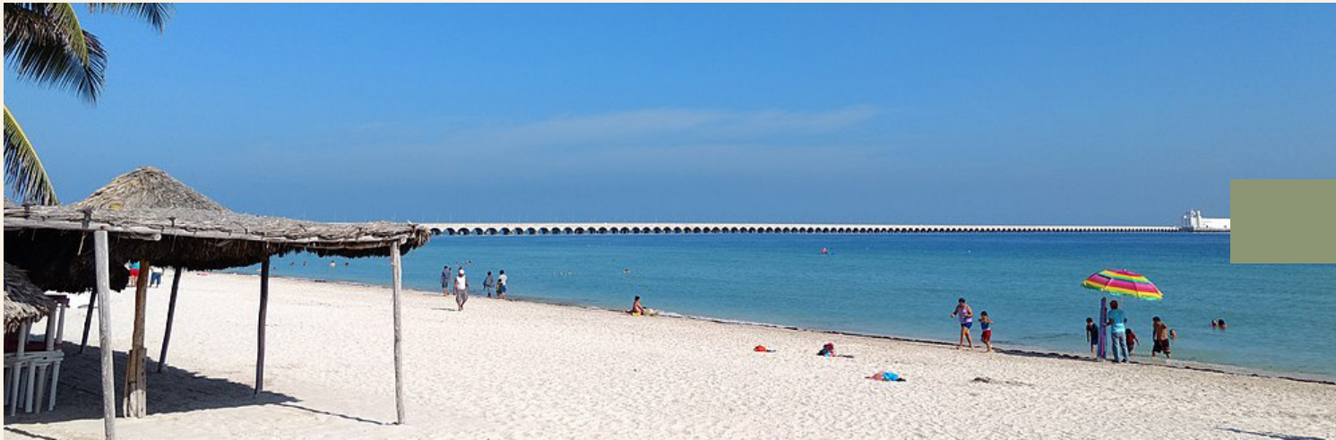
30 minutos de la playa.