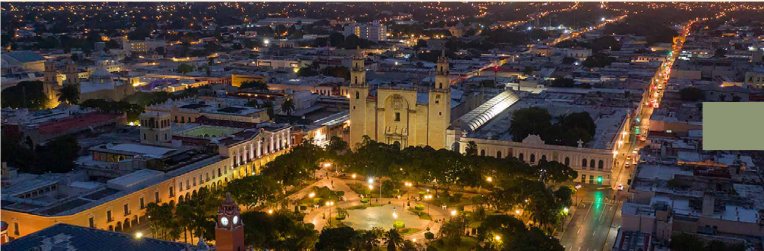
8 minutos de Mérida.