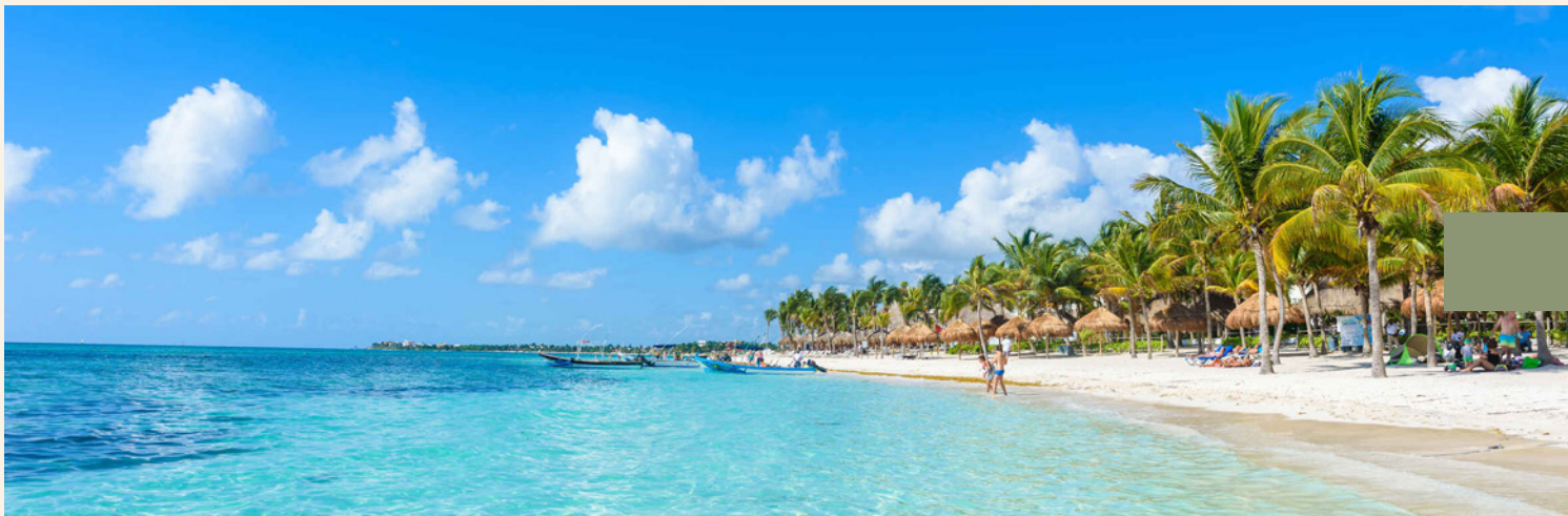
3 horas de Cancún y la Riviera Maya.