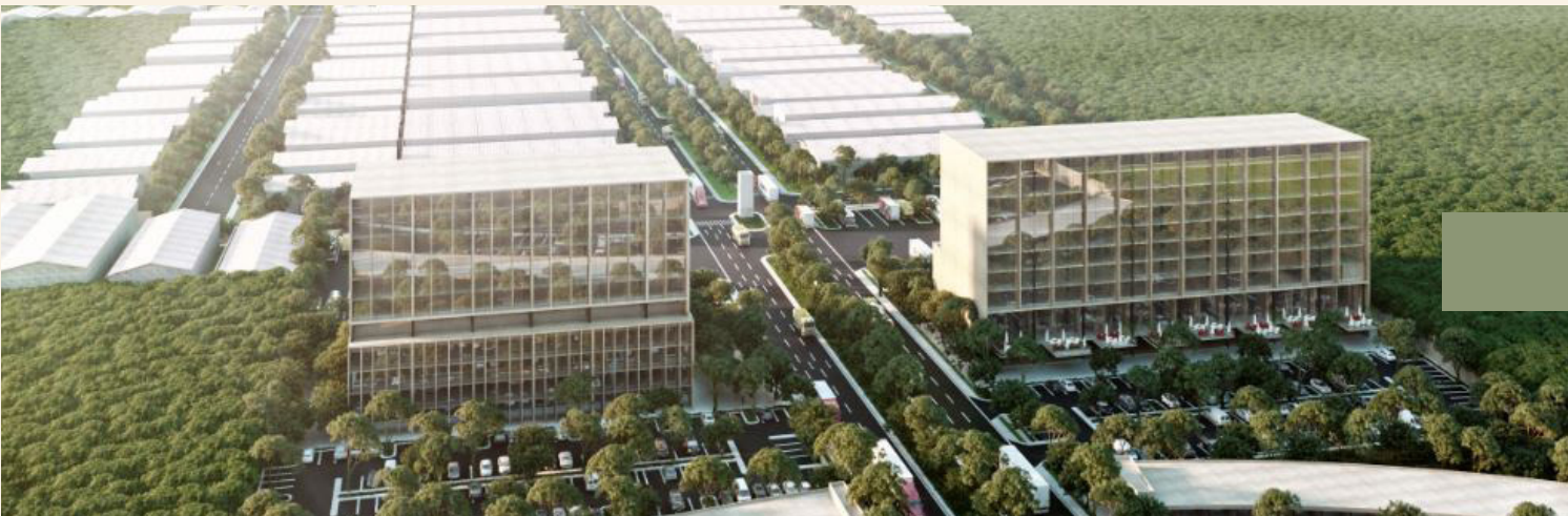
10 minutos de la zona industrial.