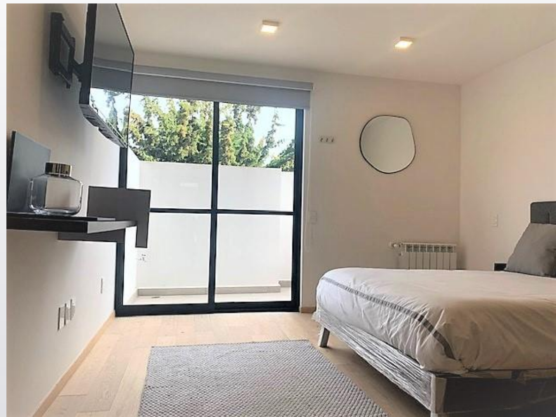
Luminarias en todo el departamento