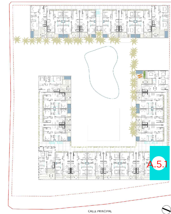
PLANTA CONJUNO 5TO NIVEL