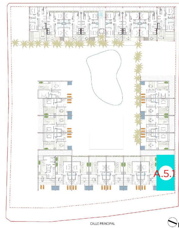
PLANTA CONJUNO 6TO NIVEL