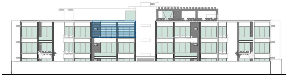
LOCALIZACIÓN FACHADA NORTE