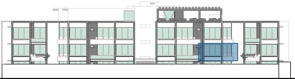
LOCALIZACIÓN FACHADA NORTE