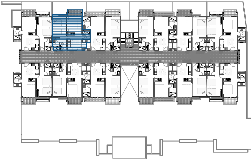
LOCALIZACIÓN PLANTA BAJA