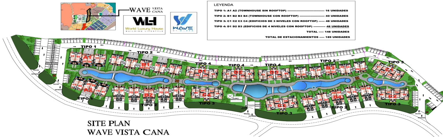
SITE PLAN WAVE VISTA CANA