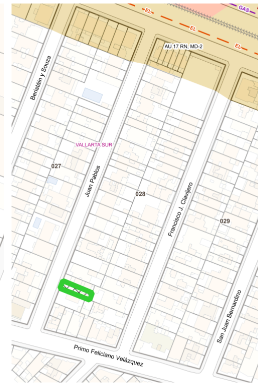
Croquis de Manzana